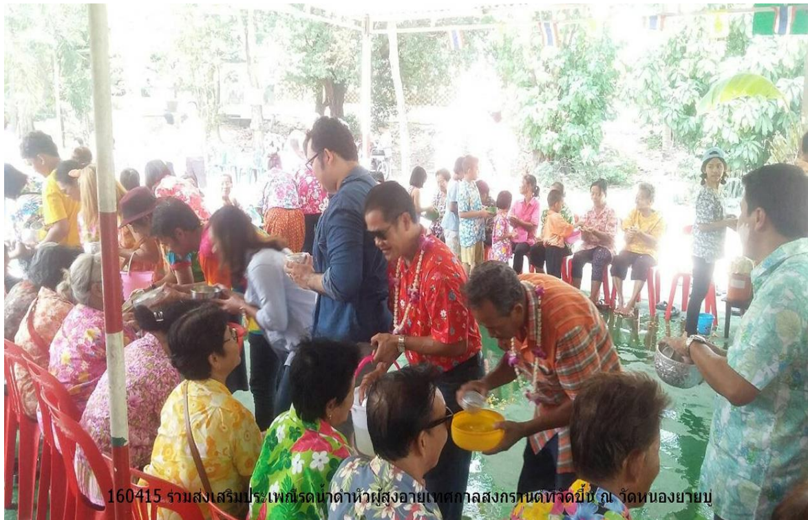
160415 รามส่งเสริมประเพณีรดน้ำดำหัวผู้สูงอายุเทศกาลสงกรานต์วัดขี้เหล็ก จ. รัตนบุรี