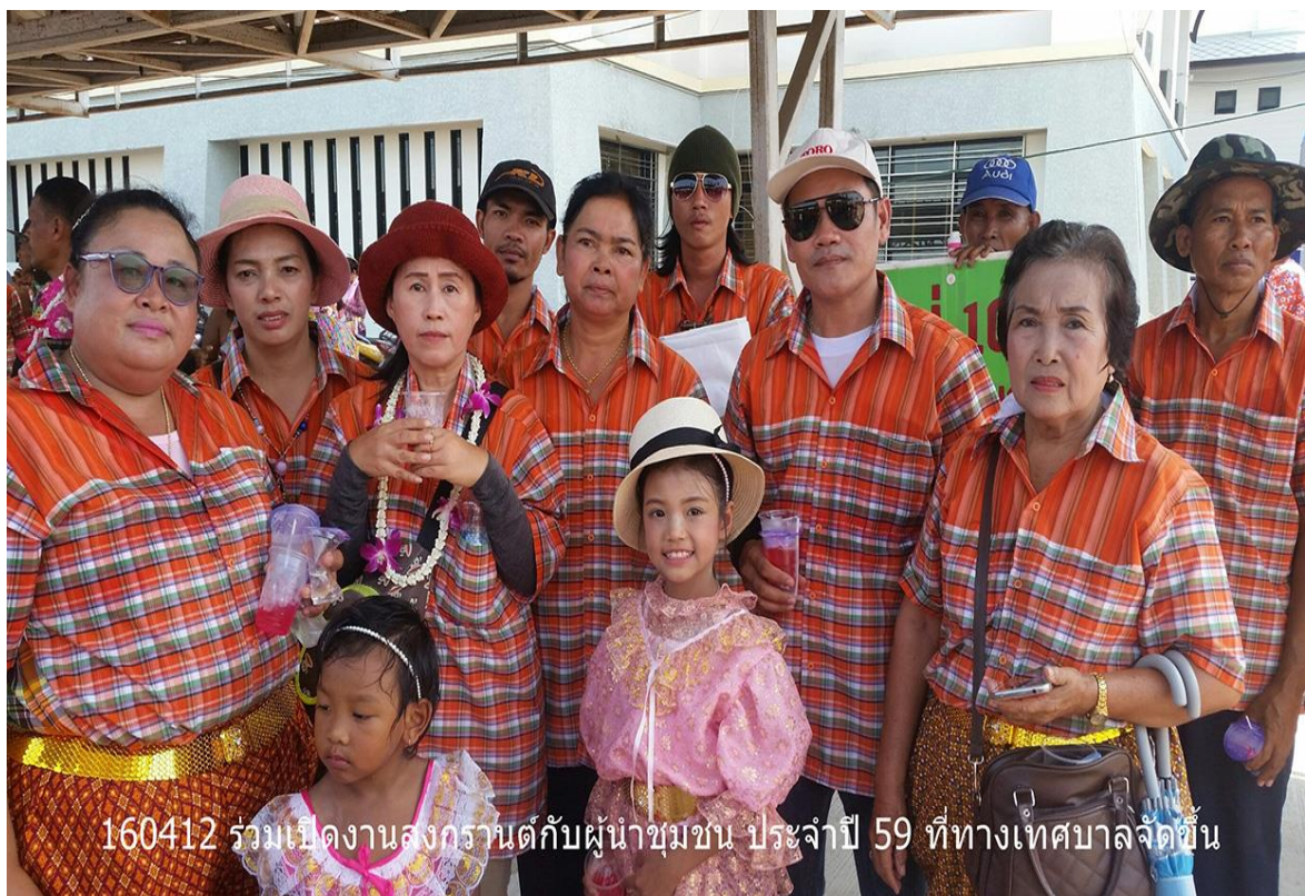
160412 ร่วมเปิดงานสงกรานต์กับผู้นำชุมชน ประจำปี 59 ที่ทางเทศบาลจัดขึ้น