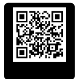
แบบประเมินความเสี่ยงต่อการติดเชื้อ COVID-19