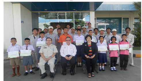
พิธีมอบทุนการศึกษาบุตร - ของพนักงาน ประจำปี 2556 จำนวน 23 ทุน ณ บริษัท อาปิโก ไฮเทค จำกัด และ บริษัท อาปิโก ผลิตเซมิคอนดักเตอร์ จำกัด วันที่ 2 เมษายน 2556