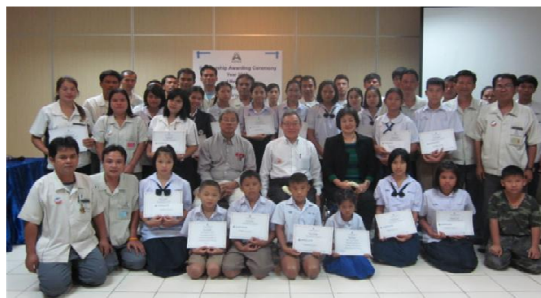
อาปิโก ไฮเทค มอบทุนการศึกษาประจำปี 2556 ให้กับบุตรธิดาพนักงานที่เรียนดี 4 พฤษภาคม 2556