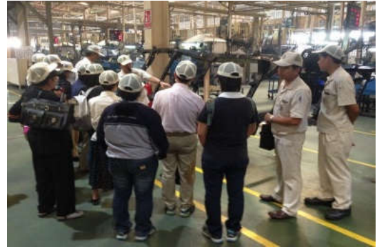
กิจกรรมผู้ถือหุ้นเยี่ยมชมโรงงานบริษัท สตรัคเจอร์ล โปรดัคส์ จำกัด ที่จังหวัดชลบุรีเมื่อวันที่ 25 พฤษภาคม 2560

บริษัทฯ เปิดเผยข้อมูลทางการเงินให้ผู้ถือหุ้นทราบและดูแลให้ข้อมูลมีความถูกต้องและแสดงสถานะที่แท้จริง การเข้าถึงข้อมูลภายในมีการควบคุมและมีการตรวจสอบอยู่เป็นประจำเพื่อป้องกันการกระทำผิดที่อาจมีผลกระทบต่อผู้ถือหุ้น นอกจากนี้ ผู้ถือหุ้นสามารถติดต่อหน่วยงานนักลงทุนสัมพันธ์ของบริษัทฯ เพื่อตอบข้อสงสัยหรือสอบถามข้อมูลของบริษัทฯ