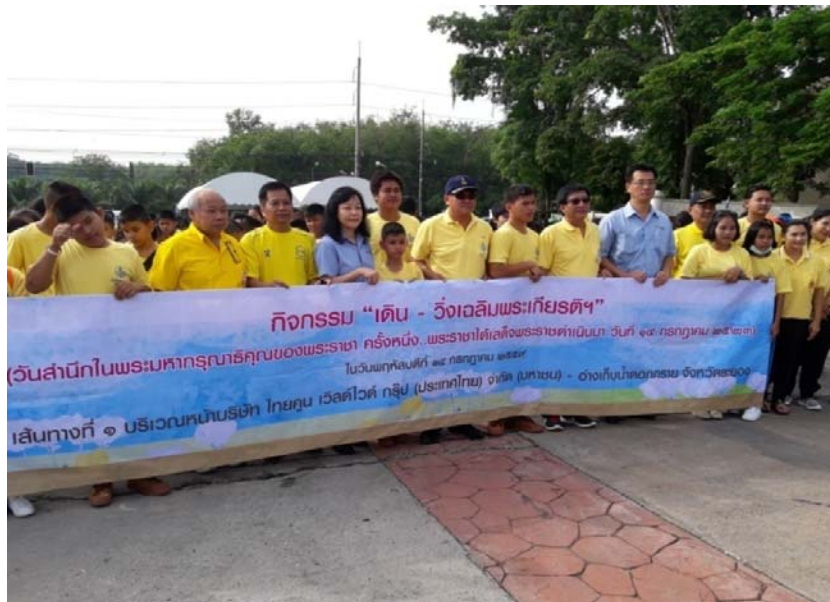
กิจกรรม เติ่น-วัง เจลิมพระเกียติฯ