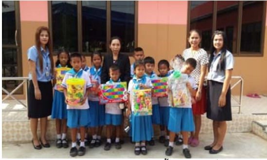
มอบอุปกรณ์การเรียนและเลี้ยงอาหารเด็ก