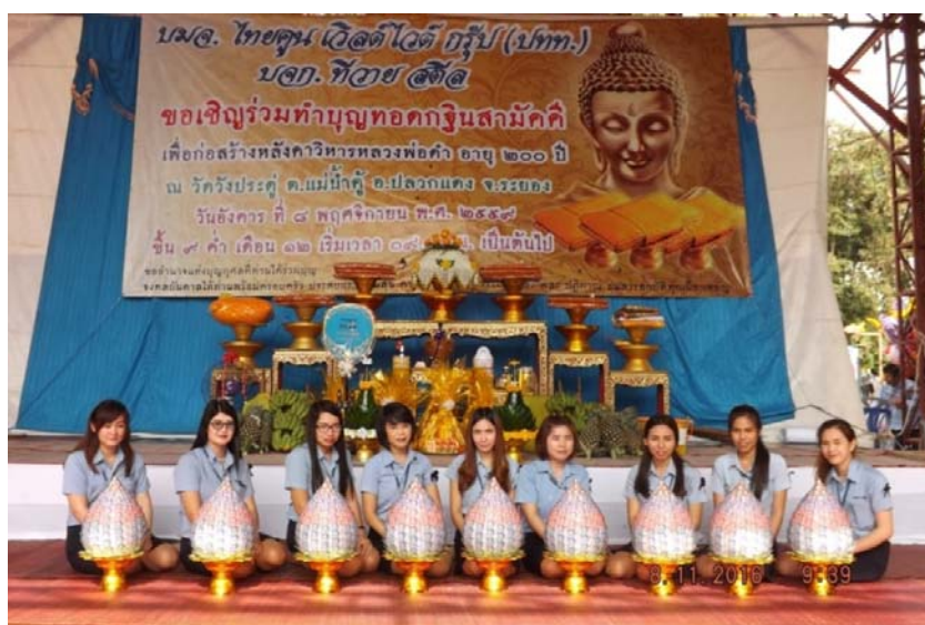
ทอดกฐินสามัคคีวัดวังประดู่