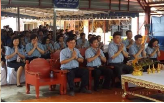
ร่วมประเพณีวันฉัตรมงคลทางพระพุทธศาสนา