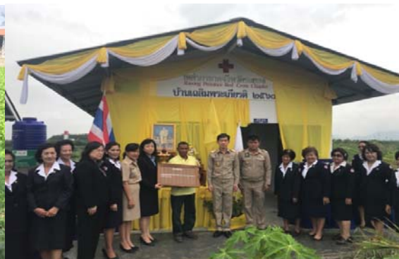
มอบเงินให้สภาเกษตรกรเพื่อสร้างบ้านให้ชาวบ้าน