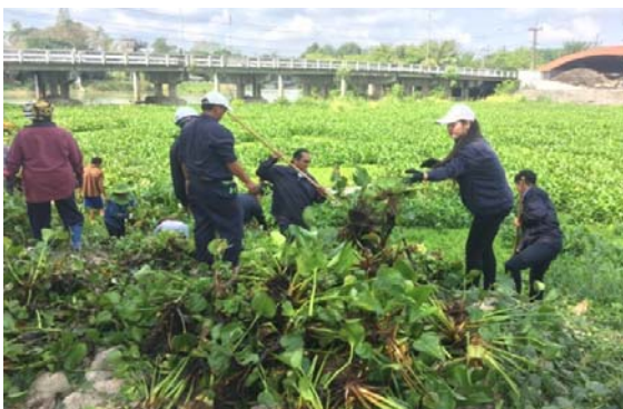
ลอกคลองร่วมกับชาวบ้าน