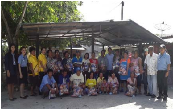
แจกถุงยังชีพให้ชาวบ้าน