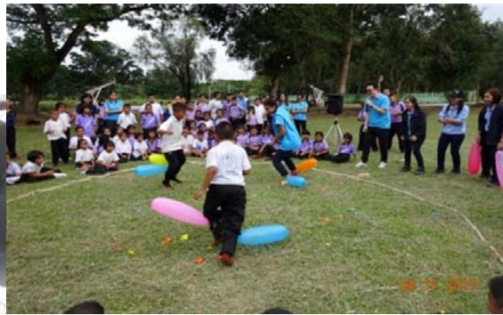
ร่วมจัดการแข่งขันกีฬาโรงเรียน