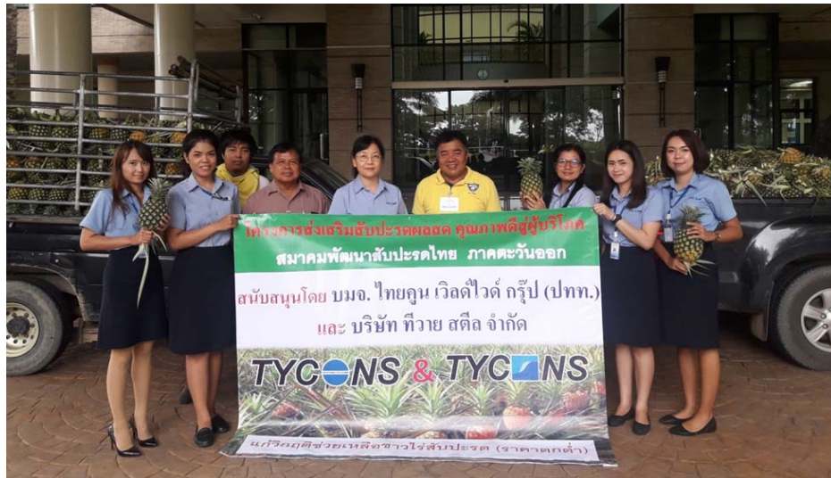
รับซื้อสับปะรดจากเกษตรกรแจกพนักงาน