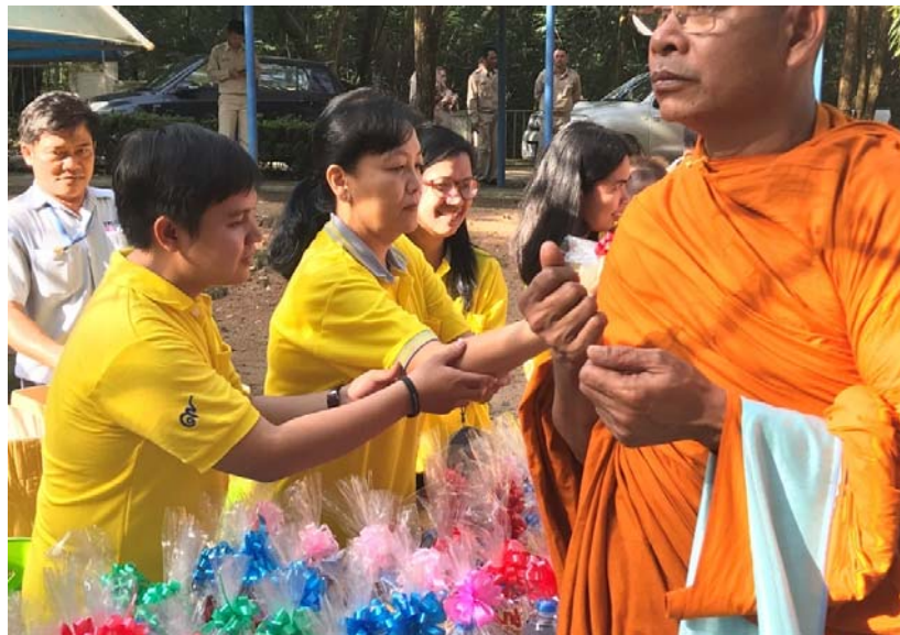
ร่วมทำบุญตักบาตร