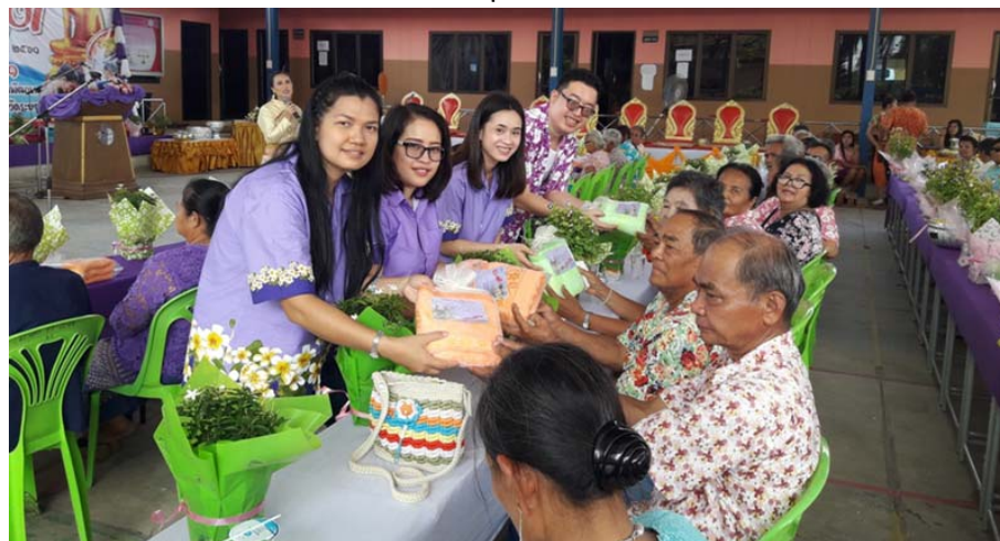
สนับสนุนประเพณีสงกรานต์ ร่วมรดน้ำดำหัวผู้สูงอายุนำสิ่งของไปมอบให้ผู้สูงอายุ