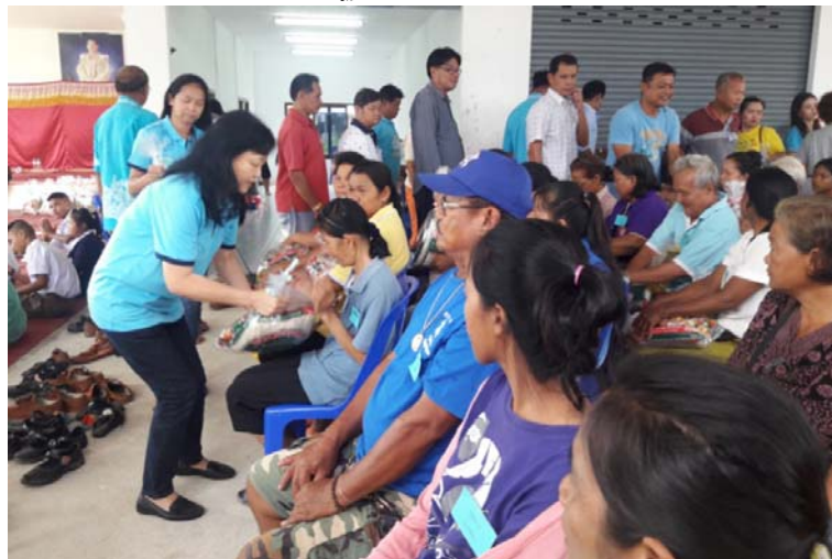
แจกถุงยังชีพให้ชาวบ้าน