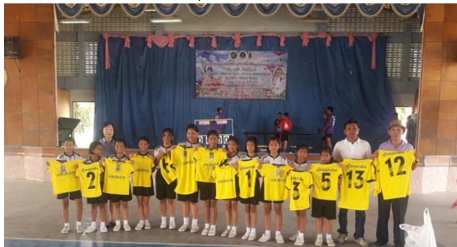
มอบเสื้อกีฬาให้นักเรียน