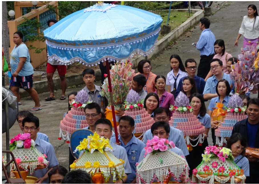
ทอดกฐินสามัคคีวัดเขาโพธิ์