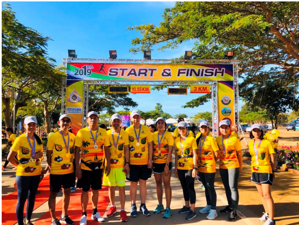
ร่วมกิจกรรมเดิน-วิ่ง มินิฮาร์ฟมาราธอนเฉลิมพระเกียรติฯ ณ ศูนย์พัฒนากีฬา