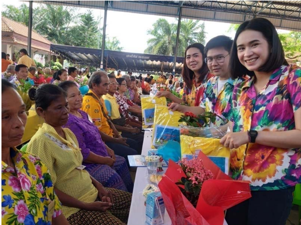
นำสิ่งของไปมอบให้ผู้สูงอายุ