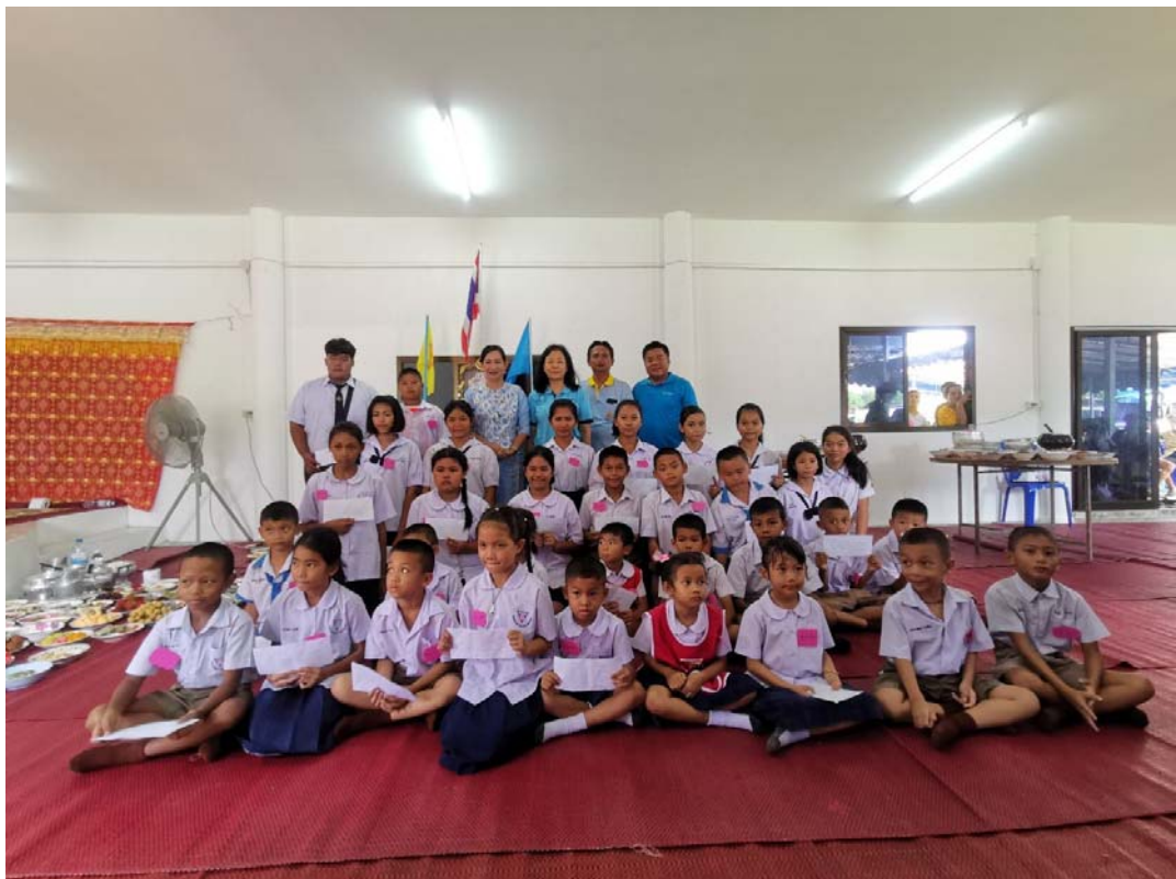
มอบทุนการศึกษาให้นักเรียน