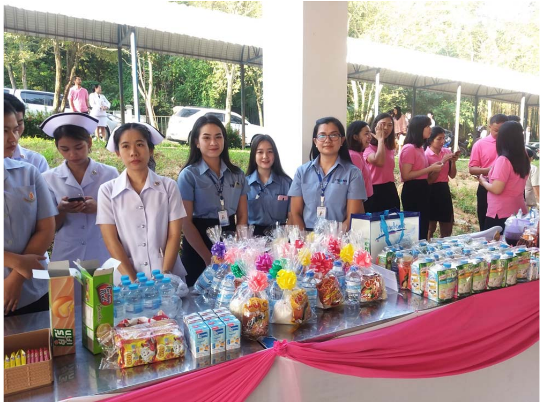
ร่วมกิจกรรมวันปิยะมหาราชที่ว่าการอำเภอเนินคมพัฒนา โดยตักบาตรข้าวสารอาหารแห้ง