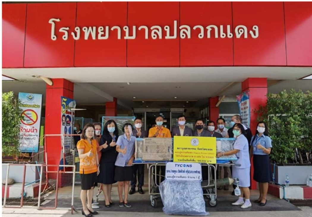
มอบเงินร่วมจัดทำตู้ความดันลบ