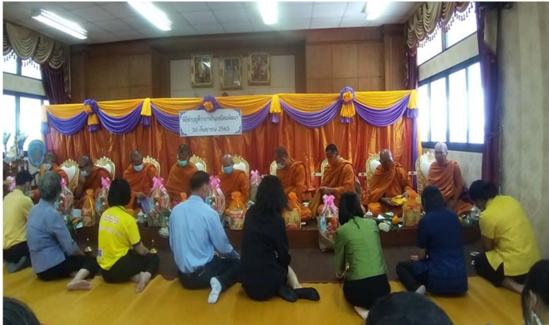
ทำบุญเลี้ยงพระ