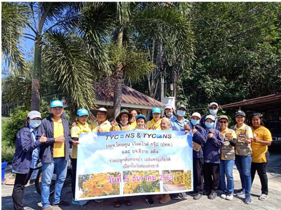
ร่วมกิจกรรมทำบุญวันพ่อแห่งชาติและปลูกต้นทองอุไรเฉลิมพระเกียรติ