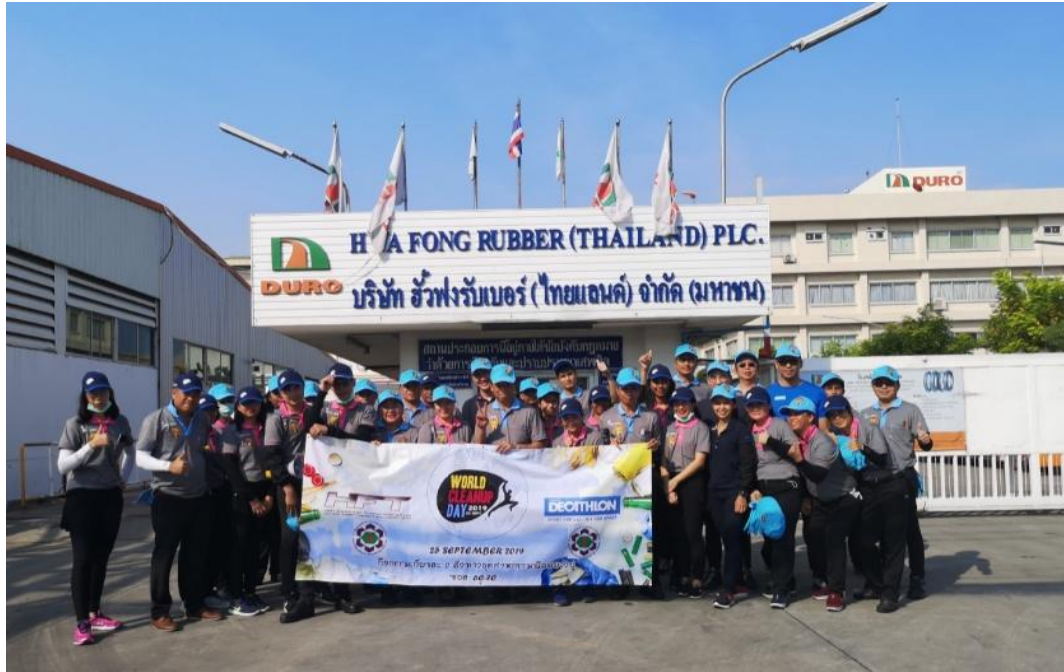
ภาพที่ 1 : ภาพถ่ายรวมระหว่างทีมงานบริษัทฮั่วฟงรับเบอร์ และ ลูกค้า DECATHLON

กิจกรรมนี้จัดขึ้นเมื่อวันที่ 25 กันยายน 2562 โดยทีมงานบริษัทฮั่วฟงรับเบอร์ (ไทยแลนด์) จำกัด มหาชน ร่วมกับลูกค้า DECATHLON อีกทั้งเชิญชวนทีมงานการนิคมอุตสาหกรรมบางปูเข้าร่วมด้วยเช่นกัน วัตถุประสงค์ของการจัดกิจกรรมนี้ขึ้นมา เพื่อให้ตระหนักถึงการทำงานเป็นทีม และอีกทั้งยังช่วยกันรักษาสภาพแวดล้อมให้น่าอยู่ยิ่งขึ้น