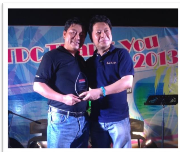
“Best Seller Award 2013 The Winner of Fortinet” สุดยอดผู้นำด้านการขาย ICT Security System

“Best Seller Award 2013 The Winner of Fortinet” จากบริษัทไอทีดีซี ตัวแทนจำหน่ายที่ได้รับการแต่งตั้งอย่างเป็นทางการจากทาง Fortinet แบนด์ชั้นนำระดับโลก ซึ่งเป็นผู้บุกเบิกเทคโนโลยี multi-threat security รางวัลนี้เป็นรางวัลที่มอบให้กับบริษัทที่มียอดขายสินค้าสูงสุดจากทางบริษัท ไอทีดีซี ในปี 2013 ซึ่งเป็นการยืนยันความสำเร็จและการเติบโตทางด้าน Security Solution วงจรในฐานะการเป็นผู้ให้บริการไอทีที่แบบครบ