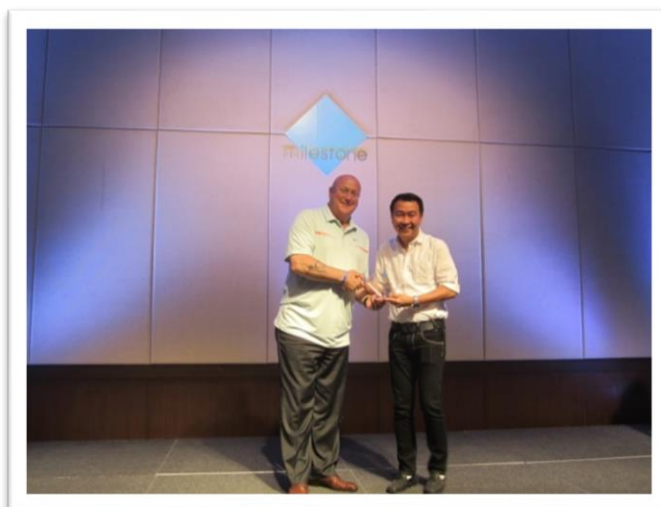
“Promising Reseller 2013 Asia” โดย Milestone Systems

รางวัลพาร์ทเนอร์ยอดเยี่ยมประจำภูมิภาคเอเชีย “Promising Reseller 2013 Asia” จาก Milestone Systems บริษัทพัฒนาซอฟต์แวร์ที่มีความเชี่ยวชาญด้านระบบจัดการภาพผ่านกล้องในระบบ IP Camera ยี่ห้อ Milestone จากประเทศเดนมาร์ก รางวัลนี้ถือเป็นความสำเร็จของบริษัท ในการทำตลาด และรวมพัฒนาสินค้าและบริการระบบจัดการภาพผ่านกล้องในระบบ IP Camera