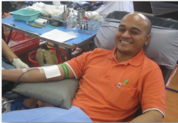
Bangkok Marathon 2013

3. บริษัทและพนักงานได้ร่วมกิจกรรมกรุงเทพมหานครมาราธอนอย่างต่อเนื่อง ทั้งนี้เพื่อส่งเสริมและสนับสนุนให้ประชาชนได้เห็นความสำคัญของการออกกำลังกาย อีกทั้งเป็นการสมทบทุนกับโครงการมูลนิธิพัฒนา ทั้งนี้เพื่อช่วยเหลือผู้ด้อยโอกาสทางสังคม