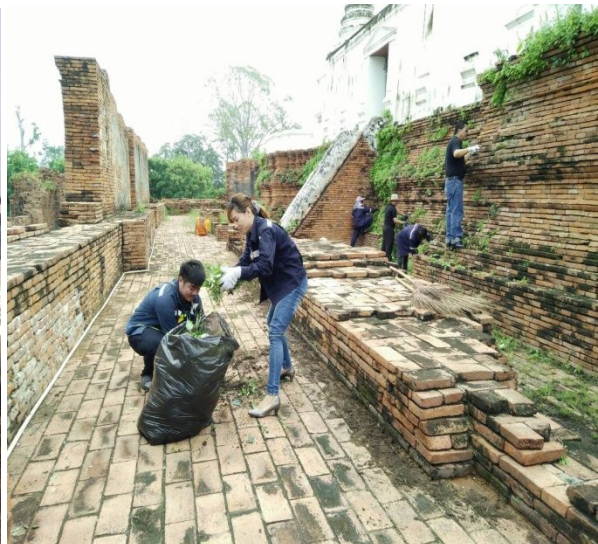
ตัวแทนพนักงานบริษัท ยูนิค ไมนิ่ง เซอร์วิส จำกัด (มหาชน) ร่วมกิจกรรม ทำความสะอาด กับ อบต.คลองสะแก อ.นครหลวง จ.พระนครศรีอยุธยา และ ปรับปรุง สถานที่บริเวณ ปราสาทนครหลวง ร่วมกับผู้ประกอบการรายอื่น ๆ และหน่วยงานราชการ ใน อ.นครหลวง จ.พระนครศรีอยุธยา