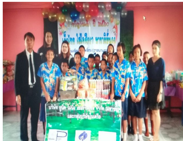
ตัวแทนพนักงานบริษัท ยูนิค ไมนิ่ง เซอร์วิส จำกัด (มหาชน) ร่วมกิจกรรม วันเด็ก กับ โรงเรียน วัด โพธิ์ทอง และวัดทอง ธรรม อ.นครหลวง จ.พระนครศรีอยุธยา