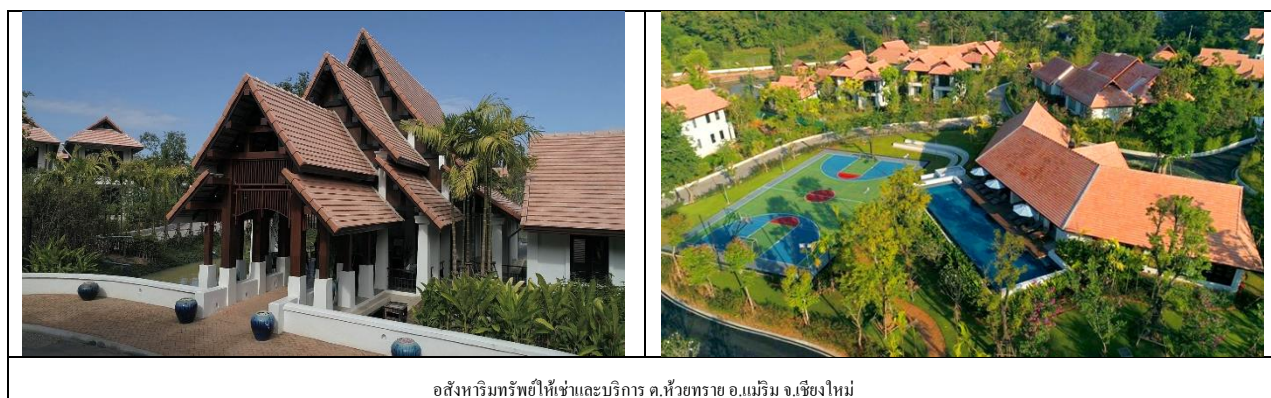
อสังหาริมทรัพย์ให้เช่าและบริการ ด.ห้วยทราย อ.แม่ริม จ.เชียงใหม่

กลุ่มบริษัทฯ ดำเนินธุรกิจอสังหาริมทรัพย์ให้เช่าและบริการ ได้เข้าซื้อที่ดินที่จังหวัดเชียงใหม่เพื่อก่อสร้างสิ่งปลูกสร้างในลักษณะเป็นรีสอร์ท เพื่อการท่องเที่ยวเชิงอนุรักษ์ชนบทและเกษตรกรรม ตามความต้องการของลูกค้า (Built-to-Suit) เพื่อให้ผู้ประกอบการธุรกิจฟื้นฟูสุขภาพ (Retreatment Center) เข้าโครงการทั้งหมดระยะยาว