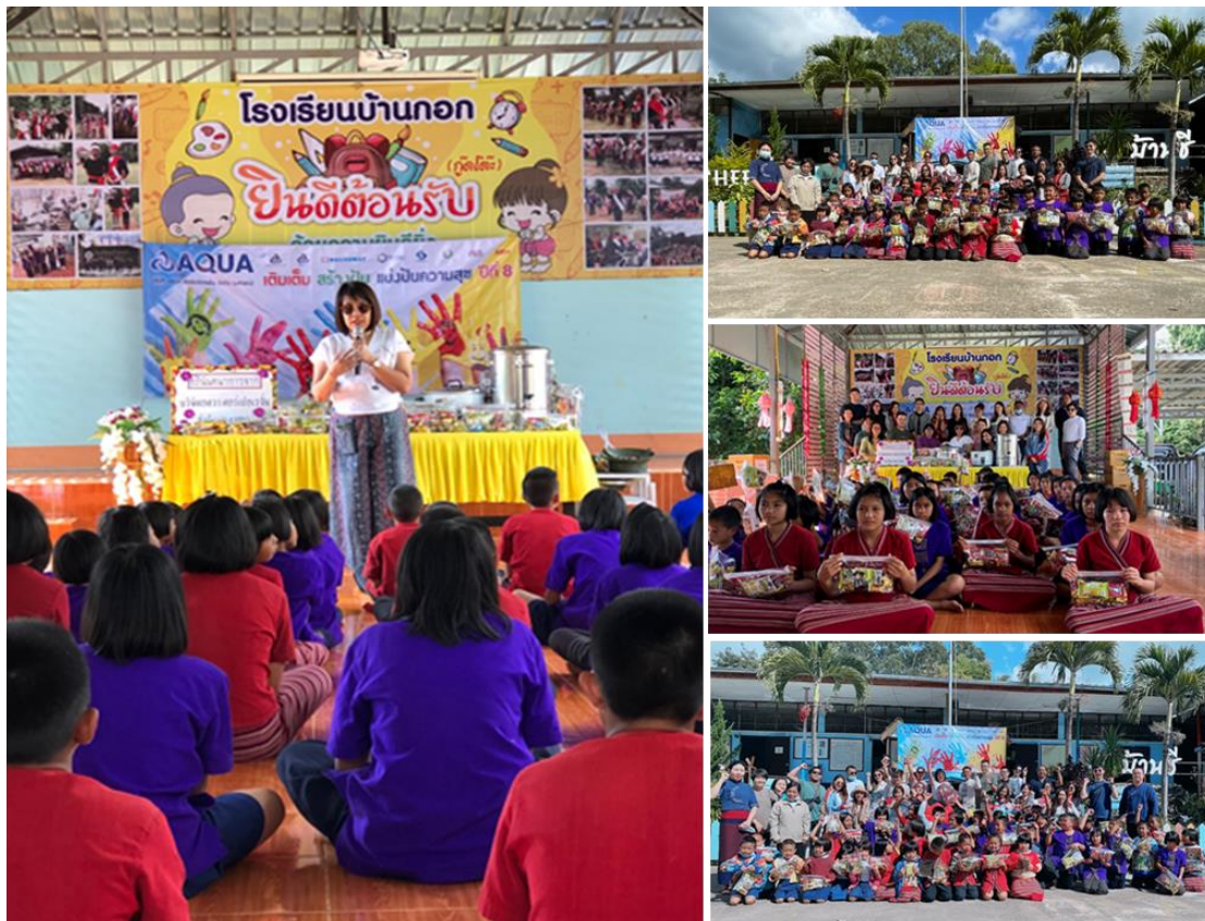
วันที่ 18 ธันวาคม 2564 ที่ตำบลเชิงกลาง อำเภอเชิงกลาง จังหวัดน่าน

ภาพกิจกรรมระหว่างผู้บริหาร พนักงานของบริษัท คุณครู และเด็กนักเรียน ในปี 2563-2564 โครงการ “น้องอิม พี่สุข” ภายใต้สโลแกน “อควา เต็มเต็ม สร้างฝัน แบ่งปัน ความสุข”