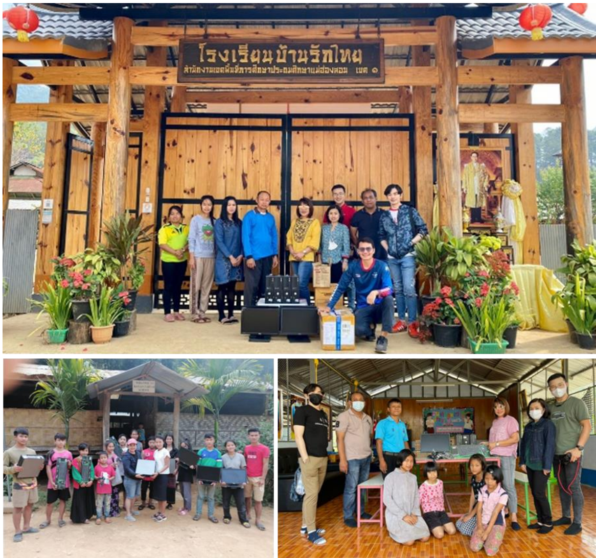
กิจกรรมบริจาคเครื่องคอมพิวเตอร์ โรงเรียนบ้านน้ำเพียงดิน (ห้องเรียนห้วยปู่แกง) 201 หมู่ 3 ตำบลผาป่อง , โรงเรียนบ้านรักไทย หมู่ 6 บ้านรักไทย ตำบลหมอกจำแป่ และ โรงเรียน KAYAN TARYAN ศูนย์อพยพบ้านใหม่ในสอย ตำบลปางหมู

2. บริษัทสนับสนุนการประชาสัมพันธ์กิจกรรมด้าน CSR ขององค์กรต่างๆ ทั้งภาครัฐและเอกชนโดยการมอบพื้นที่สื่อโฆษณาภายนอกที่อยู่อาศัยบางส่วนเพื่อให้องค์กรต่างๆ นำไปใช้เผยแพร่กิจกรรมทำความดีเพื่อสังคมสู่สาธารณะชนทั่วไป