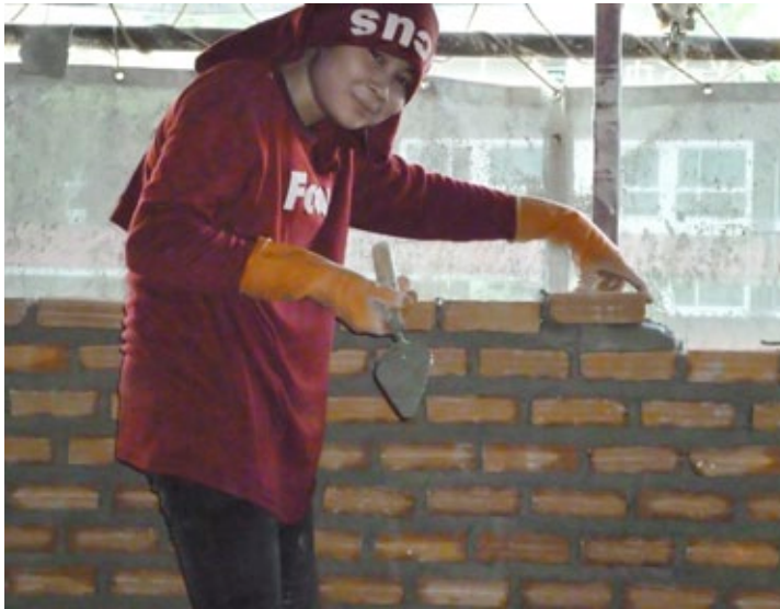
ตัวอย่างที่ 1 - การจัดฝึกอบรม on-the-job training ให้แก่คนงานก่อสร้าง

บริษัทได้จัดการฝึกอบรม on-the-job-training เกี่ยวกับการก่ออิฐฉาบปูนให้แก่คนงานก่อสร้างเพื่อพัฒนาแรงงานไร้ฝีมือ (unskilled labour) ให้เป็นแรงงานมีฝีมือ (skilled labour) เพื่อเพิ่มประสิทธิภาพในการทำงานและเพื่อให้คนงานที่ผ่านการฝึกอบรมมีรายได้เพิ่มขึ้นซึ่งจะก่อให้เกิดประโยชน์กับทั้งบริษัทและพนักงานในระยะยาว และเพื่อความยั่งยืนของบริษัท