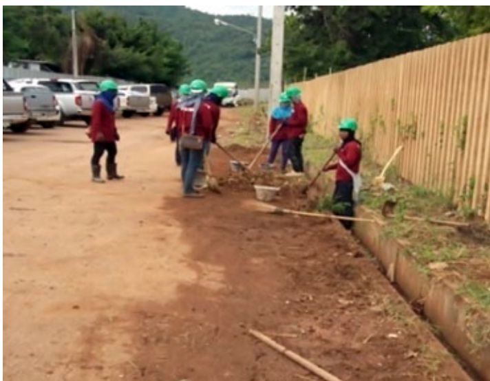
ตัวอย่างที่ 3 - คนงานก่อสร้างเคลียร์ท่อระบายน้ำและทำความสะอาดรอบๆ โครงการก่อสร้างเพื่อสิ่งแวดล้อมที่ดีและเพื่อให้สามารถระบายน้ำได้ดีขึ้น