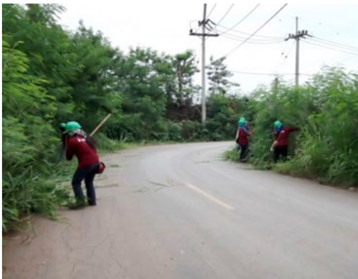
ตัวอย่างที่ 2 - คนงานก่อสร้างตัดต้นไม้ริมทางบริเวณทางเข้า-ออกโครงการก่อสร้างเพื่อให้ผู้ขับขี่มีทัศนวิสัยในการขับขี่ที่ชัดเจนและเพื่อป้องกันอุบัติเหตุ

บริษัทได้จัดการฝึกอบรม on-the-job-training เกี่ยวกับการก่ออิฐฉาบปูนให้แก่คนงานก่อสร้างเพื่อพัฒนาแรงงานไร้ฝีมือ (unskilled labour) ให้เป็นแรงงานมีฝีมือ (skilled labour) เพื่อเพิ่มประสิทธิภาพในการทำงานและเพื่อให้คนงานที่ผ่านการฝึกอบรมมีรายได้เพิ่มขึ้นซึ่งจะก่อให้เกิดประโยชน์กับทั้งบริษัทและพนักงานในระยะยาว และเพื่อความยั่งยืนของบริษัท