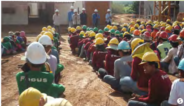
ตัวอย่างที่ 4 - คนงานก่อสร้างเคลียร์พื้นที่รอบโครงการ ก่อสร้างเพื่อสิ่งแวดล้อมที่ดี และป้องกันสัตว์ร้ายที่ไม่พึงประสงค์