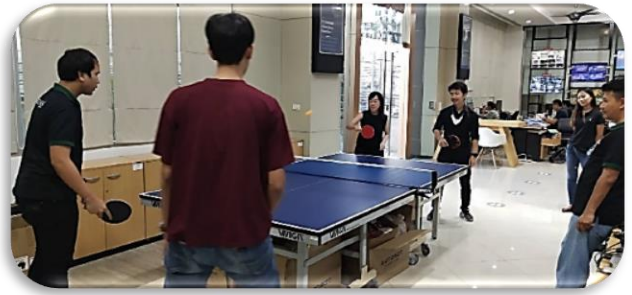
การจัดการแข่งขันปิงปองภายใน เพื่อกระชับความสัมพันธ์