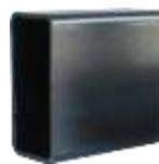
ท่อเหล็กสี่เหลี่ยมผืนผ้า