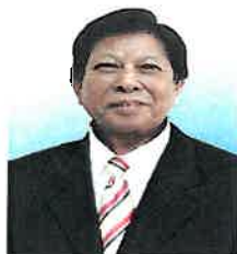
ศาสตราจารย์ ดร.สนธิ อักษรแก้ว