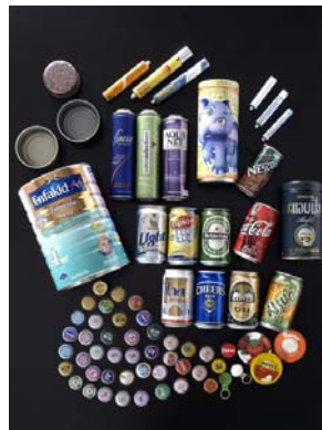
รูปตัวอย่างผลิตภัณฑ์ที่ใช้สีเคลือบบรรจุภัณฑ์