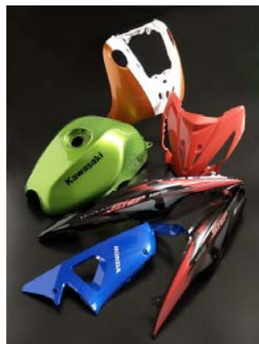
รูปตัวอย่างผลิตภัณฑ์ที่ใช้สีพ่นรถจักรยานยนต์