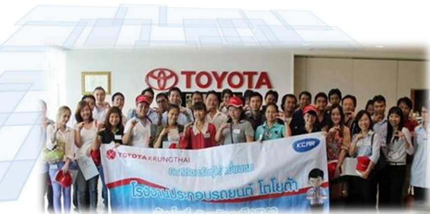
เยี่ยมชมโรงงานโตโยต้าบ้านโพธิ์