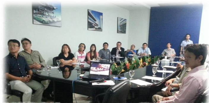
Test Drive by Kcar