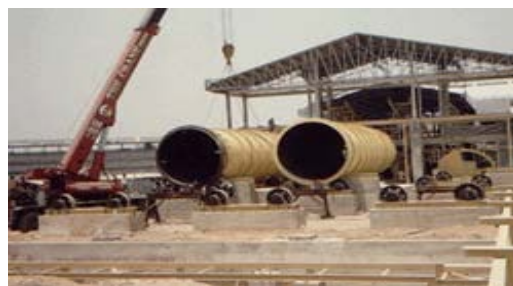
ชิ้นส่วนเตาเผา อุตสาหกรรมพลังงาน