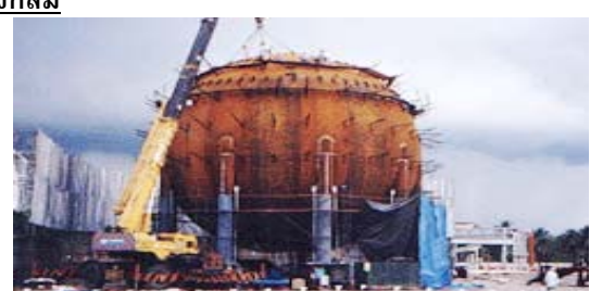
คลังเก็บก๊าซ อุตสาหกรรมพลังงาน