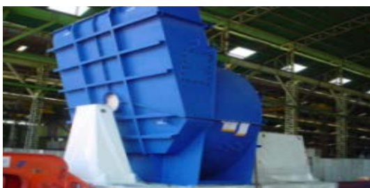
เสื้อพัดลม โรงผลิตไฟฟ้า