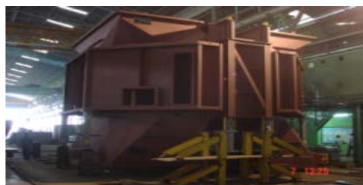
ชิ้นส่วนเครื่องปรับอากาศ โรงผลิตไฟฟ้า