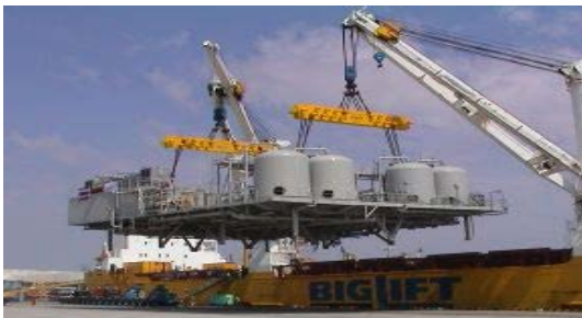
การติดตั้งเครื่องจักร อุปกรณ์ และโครงสร้างเหล็ก อุตสาหกรรมกลั่นน้ำมัน