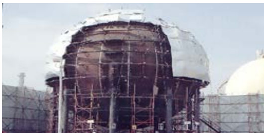
ถังเก็บก๊าซปิโตรเลียมเหลวทรงกลม อุตสาหกรรมพลังงาน