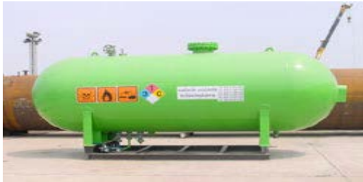
ถังเก็บแอมโมเนีย อุตสาหกรรมผลิตถ่านหิน