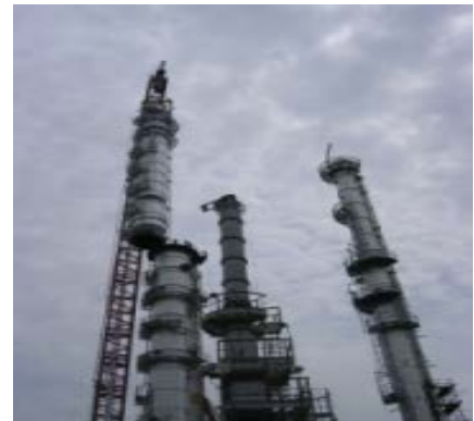
หอกลิ้น อุตสาหกรรมปิโตรเคมี