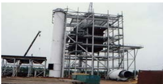
ปล่องควันไอเสียโรงงาน อุตสาหกรรมกระดาษ