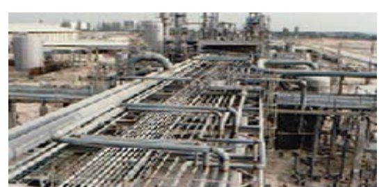
การติดตั้งระบบท่อ อุตสาหกรรมปิโตรเคมี