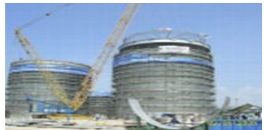
ถังเก็บสารเคมี อุตสาหกรรมปิโตรเคมี