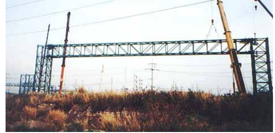
โครงสร้างหลักรับท่อ นิคมอุตสาหกรรมมาบตาพุด