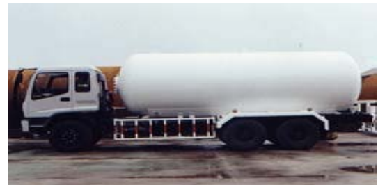
ถังเก็บก๊าซปิโตรเลียมเหลว