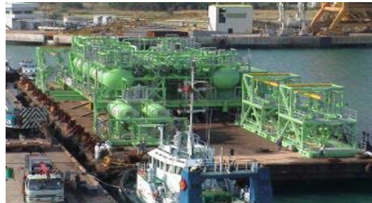
การติดตั้งเครื่องจักร อุปกรณ์ และโครงสร้างเหล็ก อุตสาหกรรมกลั่นน้ำมัน