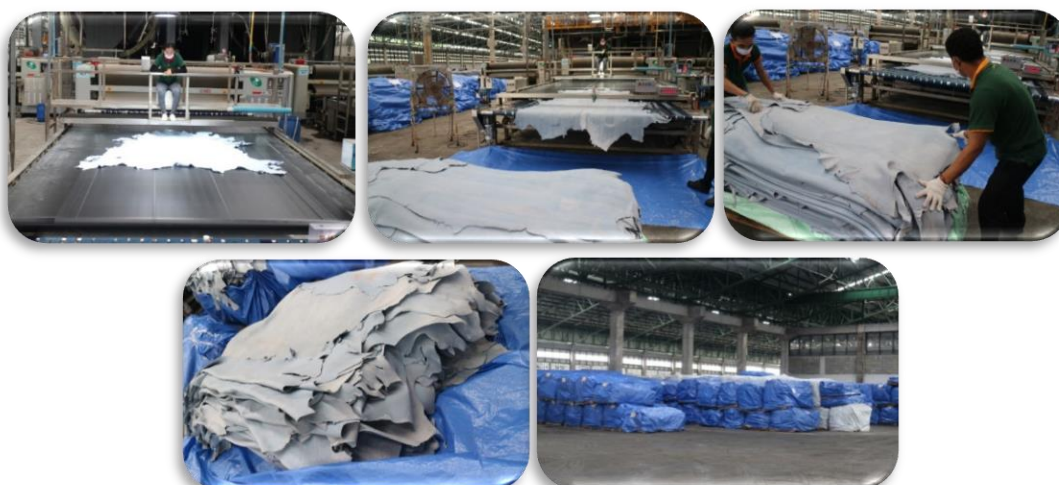
ภาพที่ 2 : หนังกึ่งสำเร็จรูป (Wet Blue)

จากประสบการณ์ที่ยืนหยัดอยู่ในอุตสาหกรรมฟอกหนังมาอย่างยาวนาน และการเป็นที่ยอมรับในแวดวงลูกค้าด้านการบริการรับจ้างฟอก (Tanning Service) จึงทำให้บริษัทได้ดำเนินการฟอกหนังกึ่งสำเร็จรูป (Wet Blue) ออกสู่ตลาด ภายใต้การกำกับดูแลจากทางบริษัทเอง