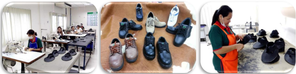
ภาพที่ 6 : รองเท้านิรภัย (Safety Shoe)

ผลิตภัณฑ์รองเท้านิรภัย (Safety Shoe) ได้รับมาตรฐาน มอก. เลขที่ 523-2554 มีรูปแบบที่ทันสมัย และยังคงคำนึงถึงความปลอดภัย โดยได้นำเศษหนังที่เหลือจากการตัดเย็บหนังหุ้มเบาะรถยนต์ นำมาเป็นวัสดุในการผลิตรองเท้านิรภัย เนื่องจากคุณสมบัติของหนังเบาะรถยนต์ที่ทนทานกว่าหนังประเภทอื่น และมีสีสันทันสมัย ซึ่งทั้งหมดนี้เป็นการลดปริมาณเศษหนังที่ออกมาจากขบวนการผลิตและลดปัญหาทางสิ่งแวดล้อมในด้านอื่น ๆ อีกด้วย