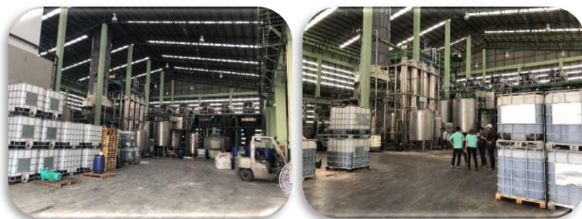
ภาพที่ 7 : ผลิตภัณฑ์โปรตีน (Protein Product)

บริษัทได้สังเกตเห็นปัญหาของการกำจัดเศษหนังที่มีโครเมียมเป็นองค์ประกอบหลัก ซึ่งเป็นปัญหาลำคัญของโรงงานฟอกหนังหลาย ๆ โรงงาน ทางบริษัทได้มีการวิจัยและพัฒนา โดยนำเศษหนังจากกระบวนการผลิตมาสกัดเป็นโปรตีน เพื่อนำกลับมาใช้ในกระบวนการผลิตอีกครั้ง เพื่อเป็นการทดแทนการใช้สารเคมี และเป็นการลดปัญหาขยะเศษหนังได้อีกทางหนึ่ง