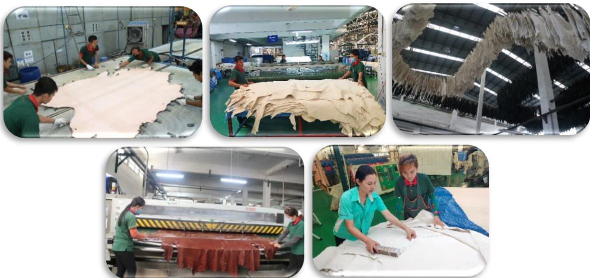
ภาพที่ 3 : หนังสำเร็จรูป (Leather)

บริษัทได้ร่วมกับค่ายรถยนต์ในการร่วมกันพัฒนาหนังสำเร็จรูปสำหรับอุตสาหกรรมรถยนต์ ให้ผ่านเกณฑ์มาตรฐาน ทั้งในด้านคุณลักษณะ คุณภาพ สี สัน ความหรูหรา รวมทั้งมุมมองของผู้ใช้รถยนต์อีกด้วย