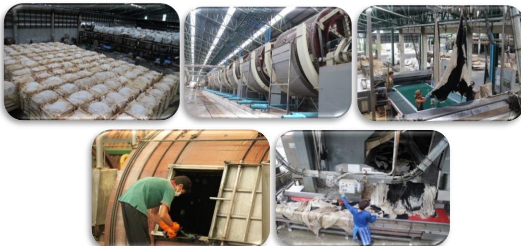
ภาพที่ 1 : บริการรับฟอกหนัง (Tanning Service)

ด้วยประสบการณ์ที่คร่ำหวอดในวงการฟอกหนังกว่า 75 ปี และการผลิตหนัง Wet Blue ด้วยเครื่องจักรอันทันสมัย สามารถรองรับการผลิตได้มากถึง 130 ล้านฟุตต่อปี และยังได้รับการรับรอง Certificate LWG “Gold” Rate จึงทำให้ลูกค้ามั่นใจได้ว่า หนัง Wet Blue ที่ผลิตจากทางบริษัท จะได้คุณภาพตามรูปแบบที่ลูกค้าต้องการ