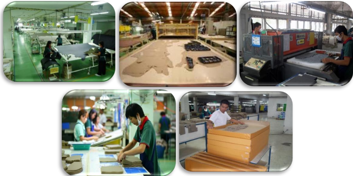
ภาพที่ 4 : ชิ้นงานหนังตัด (Cut Parts)

นอกจากบริษัทจะจำหน่ายหนังสำเร็จรูปแล้ว ยังสามารถนำหนังสำเร็จรูปมาตัดเป็นชิ้นส่วนตามรูปแบบหรือ Drawing ที่ลูกค้าหรือผู้ประกอบการเป็นผู้กำหนด ซึ่งถือได้ว่าเป็นการเพิ่มมูลค่าให้กับหนังสำเร็จรูป โดยส่วนใหญ่จะเป็นชิ้นงานประกอบสำหรับหุ้มเบาะหนังรถยนต์ พวงมาลัย หัวเกียร์และแผงประตู เป็นต้น