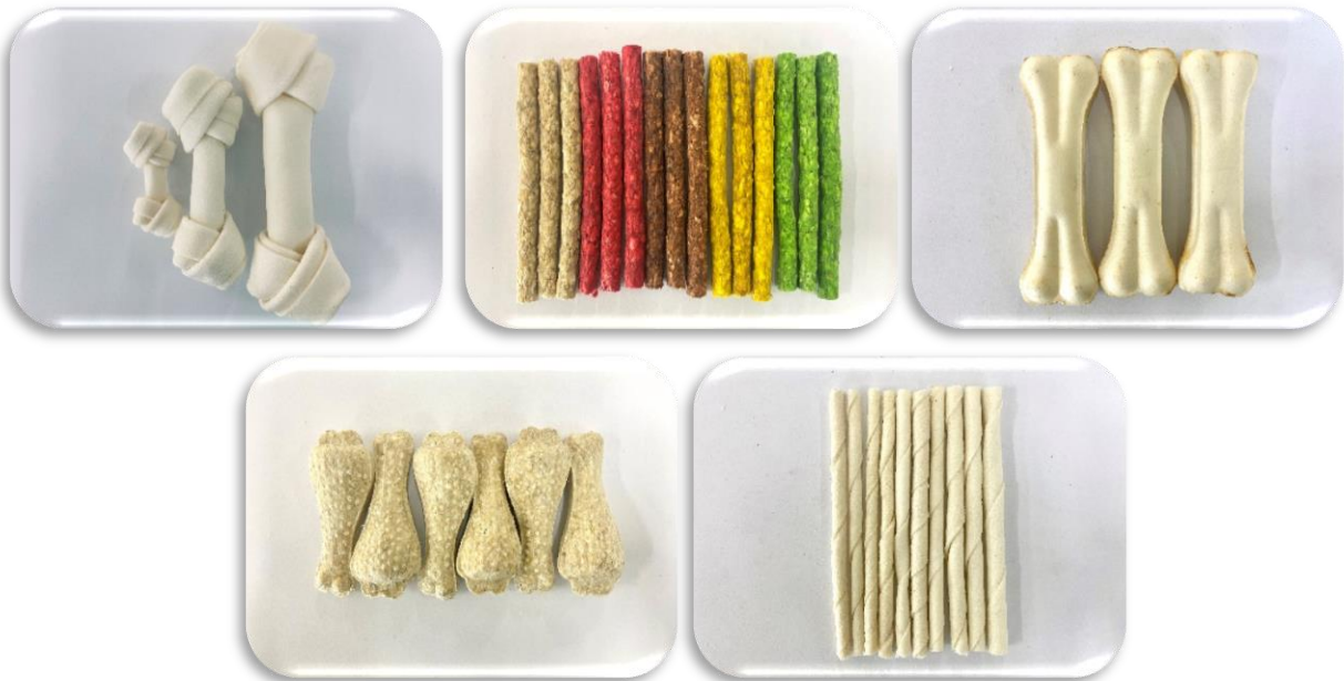
ภาพที่ 8 : ผลิตภัณฑ์ของเล่นสุนัข (Dog Chew Product)

บริษัทได้มีการต่อยอดจากผลิตภัณฑ์ผลพลอยได้ โดยการนำหนังท้องมาต่อยอดเป็นผลิตภัณฑ์ของเล่นสุนัข โดยผ่านกรรมวิธีการผลิตที่สะอาด ปลอดภัย ในรูปแบบต่าง ๆ ตามความนิยมของตลาด ทั้งผลิตภัณฑ์ Raw Hide (กระดูกหมู, กระดูกอัด, กีบเท้า) และผลิตภัณฑ์ Crunchy คือนำหนังท้องมาบดละเอียด ผสมแป้ง แต่งสี แต่งกลิ่น แล้วผ่านกระบวนการฉีดเป็นเส้น ซึ่งทางบริษัทได้ให้ความสนใจทั้งในเรื่องความสะอาดและคุณภาพ โดยบริษัทได้มีแผนการขอรับรองมาตรฐาน GMP จากสำนักพัฒนาระบบและรับรองมาตรฐานสินค้าปศุสัตว์ ภายในปี พ.ศ. 2564