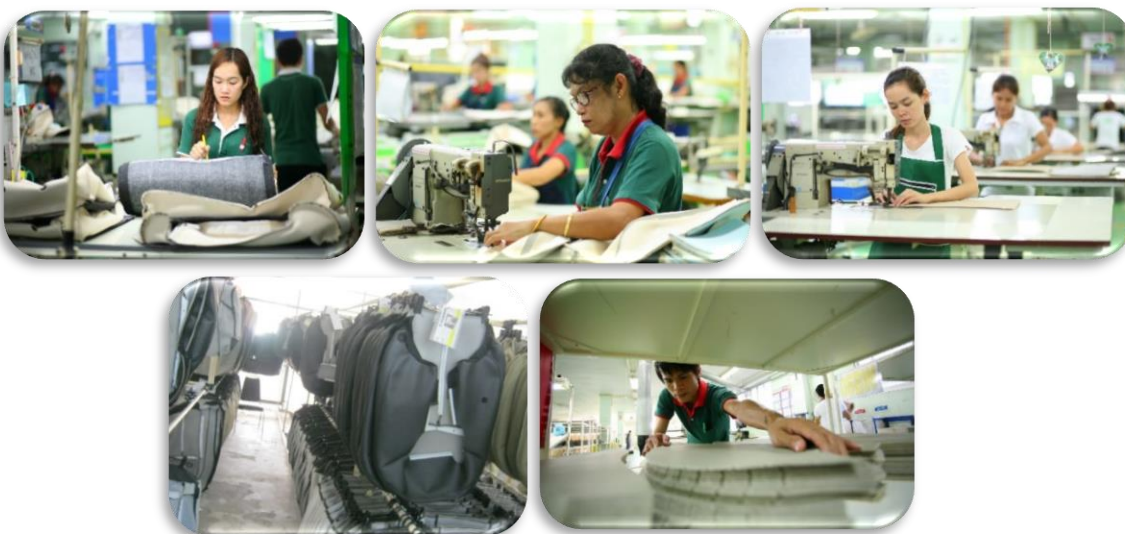
ภาพที่ 5 : หนังหุ้มเบาะรถยนต์ (Trim Cover)

เป็นการต่อ ยอดธุรกิจ โดยการนำเอาชิ้นงานหนังตัด (Cut Part) มาเย็บประกอบและขึ้นรูปเป็นหนังหุ้มเบาะรถยนต์ โดยใช้แบบตามที่ลูกค้าหรือผู้ประกอบการธุรกิจเบาะหนังรถยนต์เป็นผู้กำหนด โดยทางบริษัทได้นำเครื่องมืออัตโนมัติ มาตัดเย็บประกอบหนังหุ้มเบาะรถยนต์ และยังคงคำนึงถึงรายละเอียดคุณภาพ และคุณลักษณะที่ลูกค้าต้องการเป็นสำคัญ