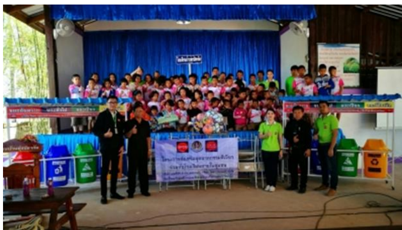
SPCG มอบเงินสนับสนุนกิจกรรมวันเด็กแห่งชาติ ประจำปี 2560 เทศบาลตำบลบ้านค้อ อำเภอมือง จังหวัดขอนแก่น เมื่อวันที่ 14 มกราคม 2560 ที่ผ่านมา