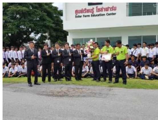
United States Agency for International (USAID)