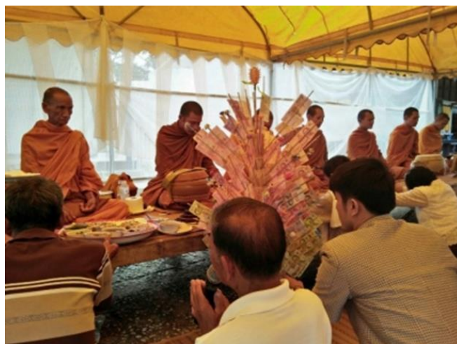
SPCG ให้สนับสนุนร่วมเป็นเจ้าภาพ “ทอดผ้าป่าเพื่อการศึกษา ประจำปี 2560” ให้แก่โรงเรียนบ้านนุ่งตาข่าย ตำบลปากอวน อำเภอวังสะพุง จังหวัดเลย เมื่อวันที่ 3 สิงหาคม 2560 ที่ผ่านมา