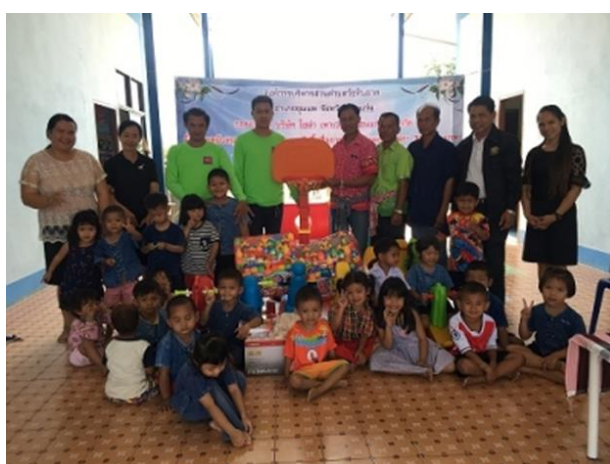
SPCG มอบเงินสนับสนุน สื่อการเรียนการสอนและเครื่องเล่นสนามกลางแจ้ง ให้แก่องค์การบริหารส่วน ตำบลวังหินลาด อำเภอชุมแพ จังหวัดขอนแก่น เมื่อวันที่ 7 เมษายน 2560 ที่ผ่านมา