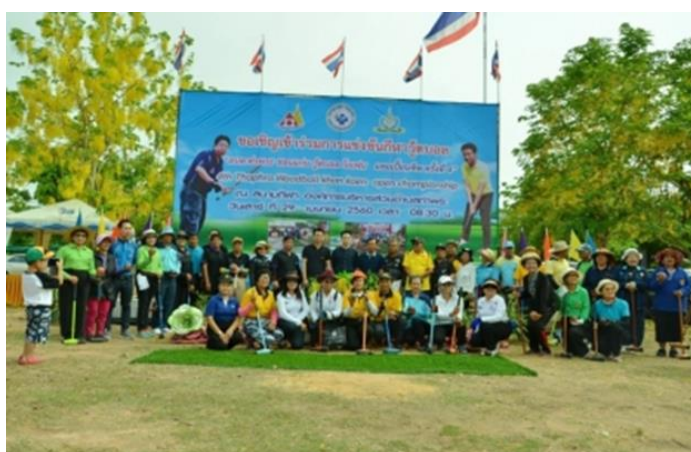
SPCG สนับสนุนงบประมาณและเครื่องตีจัดการแข่งขัน “อบต.ท่าพระ วู้ดบอล ขอนแก่นโอเพ่น แชมป์เปียนชิพ ครั้งที่ 4” ให้แก่ ชมรมวู้ดบอล อบต.ท่าพระ ร่วมกับกองทุนหลักประกันสุขภาพในระดับท้องถิ่น เมื่อวันที่ 29 เมษายน 2560 ที่ผ่านมา