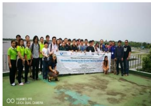
โรงเรียนบ้านสัมฤทธิ์ อ.พิมาย จ.นครราชสีมา