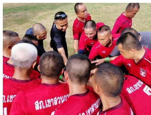
SPCG สนับสนุนการแข่งขันกีฬา ดำรงจตุรชอนแก่นสัมพันธ์ อ.เขาสวนกวาง จ.ขอนแก่น