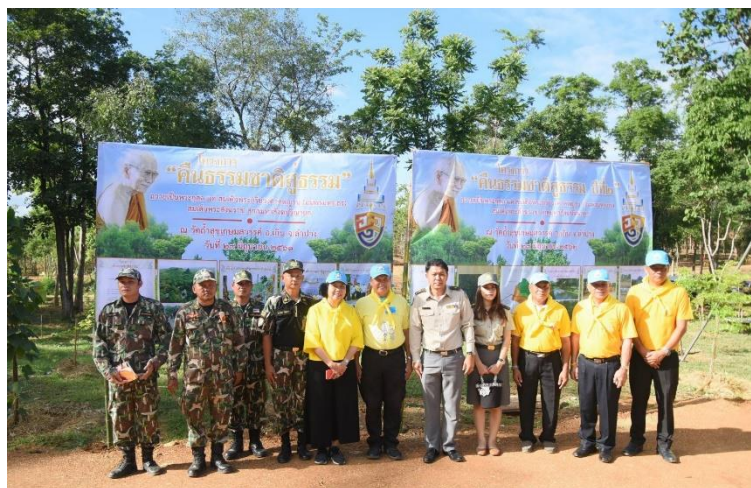
SPCG ร่วมพิธีเปิดโครงการ “คินอรรถชาติสู่ธรรม ปีที่ 2” วัดถ้ำสุกเขมสวรค์ อ.เถิน จ.ลำปาง

SPCG ตระหนักถึงความสำคัญในการดำเนินธุรกิจเพื่อสร้างประโยชน์ต่อสังคมและสิ่งแวดล้อมอย่างยั่งยืน ภายใต้นโยบายในการส่งเสริมและสนับสนุนการดำเนินกิจกรรมเพื่อสังคม ซึ่งเป็นการคืนกำไรสู่สังคม ด้วยการจัดกิจกรรมให้ความรู้ มอบทุนการศึกษา สนับสนุนกิจกรรมทางการศึกษา รวมถึงกิจกรรมเพื่อสังคมอื่นๆ ในรอบปี 2562 ที่ผ่านมามีดังนี้