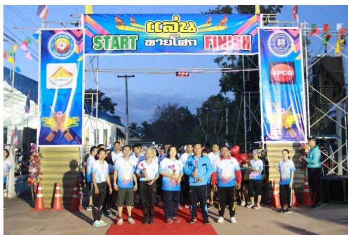
SPCG สนับสนุนโครงการรณรงค์เดิน - วิ่ง เพื่อสุขภาพตำบลหายโศก อ.บ้านผือ จ.อุดรธานี