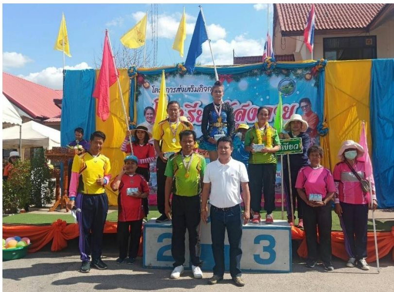
SPCG สนับสนุนกิจกรรมแข่งขันกีฬาและนันทนาการผู้สูงอายุ อ.วังสะพุง จ.เลย