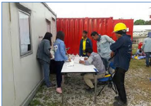
การตรวจวัดความดันก่อนเริ่มงาน