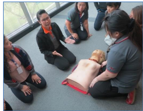
การอบรมหลักสูตรปฐมพยาบาล