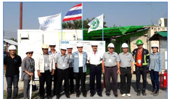
กิจกรรม Top Management Tour