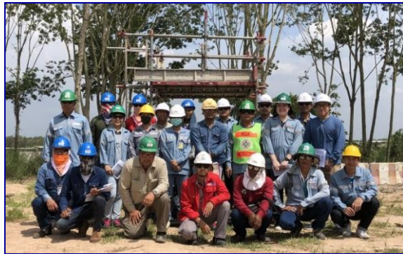
การอบรมหลักสูตรนั่งร้าน