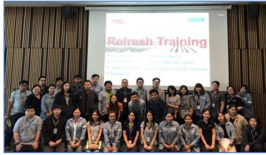
การอบรมหลักสูตร Refresh for ISO 9001:2015, ISO 14001:2015 และ OHSAS 18001:2007