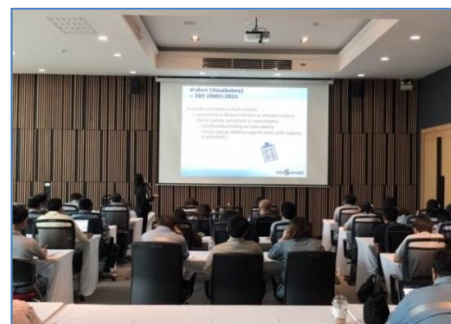
การอบรมหลักสูตร Internal Auditor