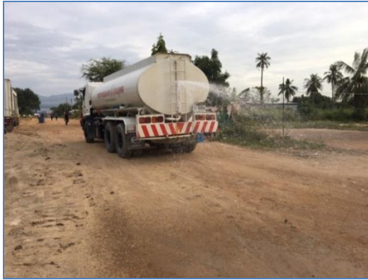
การฉีดพรมน้ำเพื่อลดฝุ่น