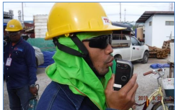
การตรวจวัดแอลกอฮอล์