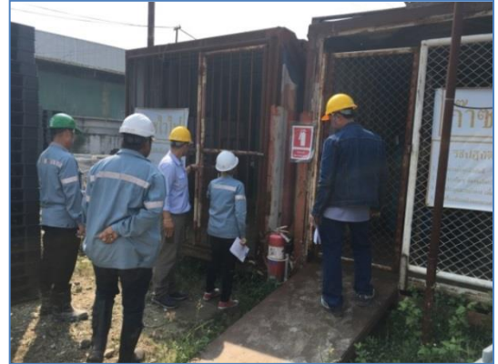
ภาพแสดงการตรวจประเมิน CSM (Contractor Safety Management) จาก บริษัท เอสซีซี เคมิคอลส์ จำกัด