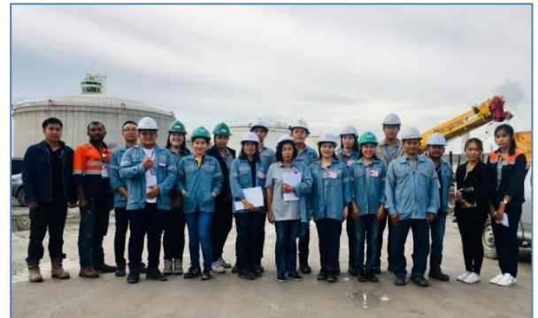
การตรวจประเมิน SHE Award