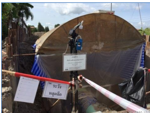
การตรวจวัดค่าฝุ่นละออง

บริษัทฯ ได้กำหนดแนวทางการควบคุมการปฏิบัติงานให้เป็นไปตามที่กฎหมายกำหนด และไม่ให้เกิดกระทบต่อสิ่งแวดล้อมและชุมชน เช่น การจัดการขยะอันตราย การบริหารจัดการน้ำทิ้ง/น้ำเสียในโครงการ การดูแลป้องกันการเกิดฝุ่นละอองในอากาศจากการก่อสร้างโดยมีการ ตรวจวัดค่าฝุ่นละอองในอากาศ เป็นต้น