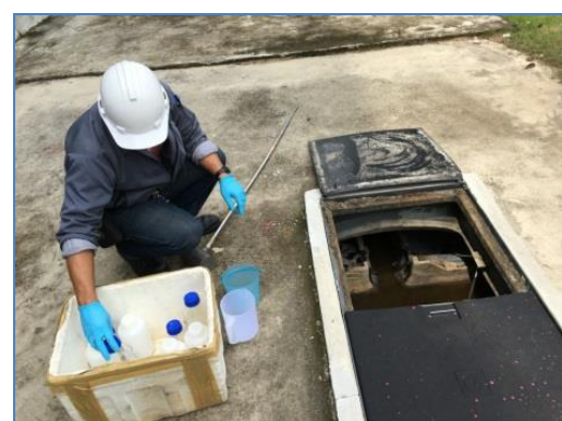
การตรวจวัดคุณภาพน้ำทิ้ง