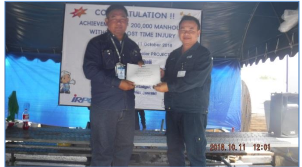
กิจกรรม Man-hour Achievement Award