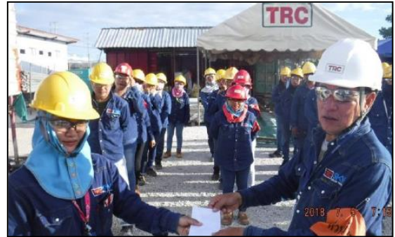
การมอบรางวัลจากกิจกรรมเพื่อนช่วยเพื่อน