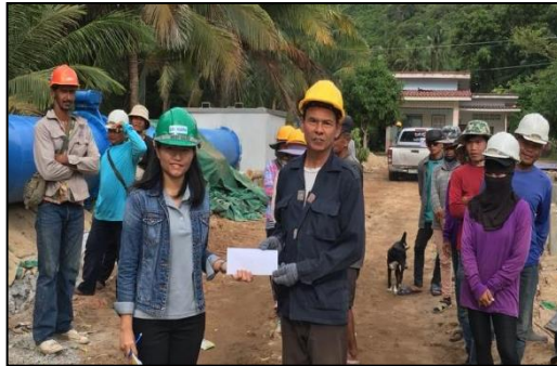
การมอบรางวัลจากกิจกรรมเพื่อนช่วยเพื่อน