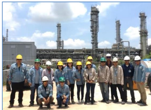
การตรวจประเมิน SHE Award