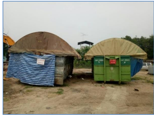
การจัดการขยะในพื้นที่ปฏิบัติงาน

นอกจากนั้นแล้ว ยังมีการจัดกิจกรรมที่ปลูกสำนึกการใช้และรักษาทรัพยากรธรรมชาติและสิ่งแวดล้อม อาทิเช่น