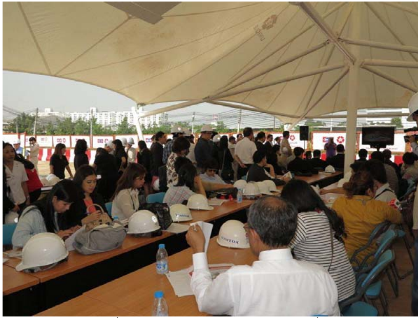
ท่านผู้มีเกียรติและสื่อมวลชน ร่วมชมวีดิทัศน์และฟังการบรรยายเกี่ยวกับโครงการฯ