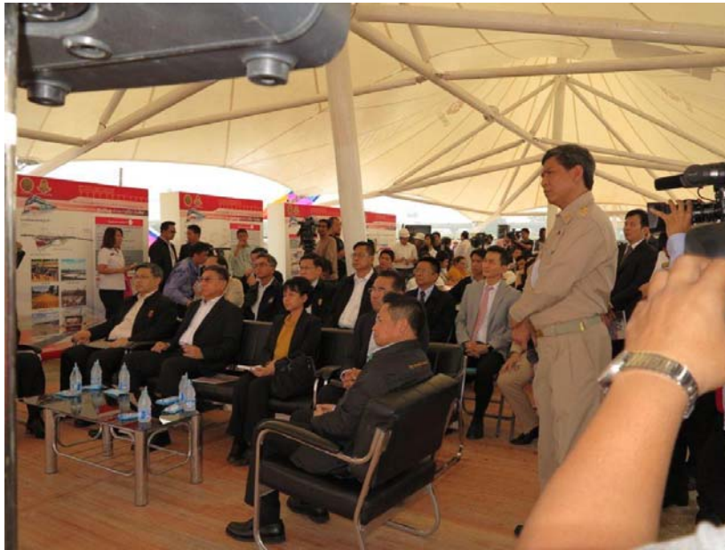
รัฐมนตรีว่าการกระทรวงคมนาคม ปลัดกระทรวงคมนาคม พร้อมคณะ ท่านผู้มีเกียรติ และผู้สื่อข่าว ร่วมชมวิดิทัศน์เกี่ยวกับโครงการระบบรถไฟฟ้าขนส่งมวลชน (สายสีแดง) ช่วง บางซื่อ – รังสิต สัญญาที่ 1