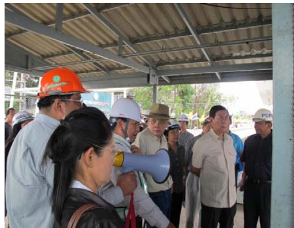
ชี้แจงมาตรการป้องกันผลกระทบสิ่งแวดล้อมการก่อสร้างโครงการรถไฟฟ้าสายสีน้ำเงินส่วนต่อขยาย สัญญาที่ 3