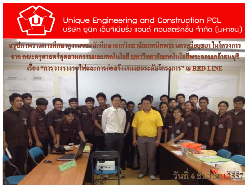
การศึกษาดูงานของนักศึกษาปวส ของ วิทยาลัยเทคนิคพระนครศรีอยุธยาศึกษาดูงานที่ Red Line