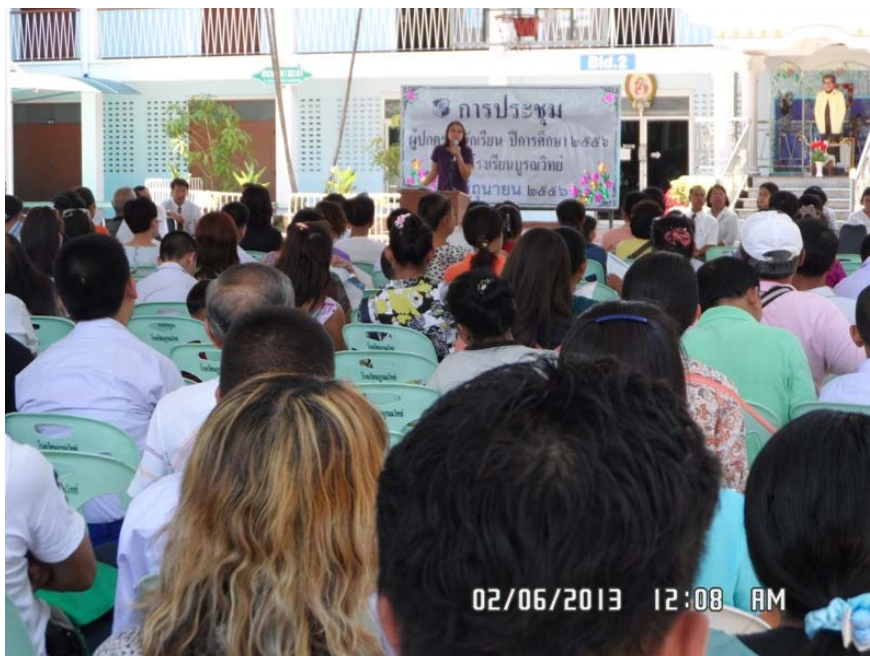
ประชาสัมพันธ์โครงการรถไฟฟ้าสายสีน้ำเงินส่วนต่อขยาย สัญญาที่ 3 ณ โรงเรียนบูรณะวิทย์

นอกจากนี้ สำนักงานภาคสนามของโครงการต่างๆ ยังได้ให้การสนับสนุนช่วยเหลืออื่นๆ ที่เป็นประโยชน์ต่อสังคม และชุมชนใกล้เคียงพื้นที่โครงการอีกด้วย เช่น การจัดทำป้ายรถเมล์ชั่วคราว การจัดทำทางและเชื่อมต่อไหล่ทางที่ต่างระดับกันให้มีระดับเสมอกันทำให้ประชาชนที่ใช้พื้นที่ดังกล่าวได้รับความสะดวก และไม่เกิดอันตรายในการใช้ทางระหว่างการก่อสร้าง รวมถึงการทำทางเชื่อมเข้า-ออกให้กับชุมชนใกล้เคียง เพื่อการสัญจรไปมาที่สะดวกยิ่งขึ้นในฤดูฝนสำหรับประชาชนในพื้นที่อีกด้วย เป็นต้น