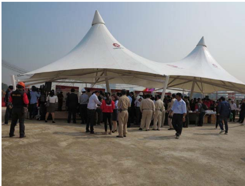
การจัดเตรียมพื้นที่และความพร้อมในการต้อนรับรัฐมนตรีว่าการกระทรวงคมนาคม ปลัดกระทรวงคมนาคม พร้อมคณะ

(4.2) การรถไฟแห่งประเทศไทย ร่วมกับ บริษัท ได้ให้การต้อนรับ พล.อ.อ.ดร.ประจักษ์ จันทอง รัฐมนตรีว่าการกระทรวงคมนาคม คุณสร้อยทิพย์ ไตรสุทธิ์ ปลัดกระทรวงคมนาคม พร้อมคณะ ที่เดินทางมาเยี่ยมชมและติดตามผลการดำเนินงานโครงการระบบขนส่งมวลชนทางรางในพื้นที่กรุงเทพมหานครและปริมณฑล : โครงการระบบรถไฟฟ้าชานเมือง (สายสีแดง) ช่วงบางซื่อ – รังสิต สัญญาที่ 1 งานโยธาสถาบันกลางบางซื่อและศูนย์ซ่อมบำรุง ณ บริเวณก่อสร้างสถานีกลางบางซื่อ (Grand Station) ในการนี้ การรถไฟแห่งประเทศไทย ได้บรรยายสรุปผลการดำเนินการก่อสร้าง รวมถึงตลอดถึง ปัญหาอุปสรรคในการก่อสร้าง จากนั้น รัฐมนตรีว่าการกระทรวงคมนาคม และปลัดกระทรวงคมนาคม พร้อมคณะ ได้เยี่ยมชมนิทรรศการเกี่ยวกับโครงการฯ และเดินทางตรวจพื้นที่ก่อสร้างโครงการระบบรถไฟฟ้าชานเมือง (สายสีแดง) ช่วงบางซื่อ – รังสิต สัญญาที่ 1 งานโยธาสถาบันกลางบางซื่อ และศูนย์ซ่อมบำรุง ตลอดเส้นทาง