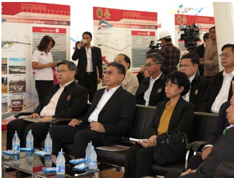
รัฐมนตรีว่าการกระทรวงคมนาคม ปลัดกระทรวงคมนาคม พร้อมคณะ ชมวิดีโอทัศน์เกี่ยวกับโครงการระบบรถไฟฟ้าชานเมือง(สายสีแดง) ช่วงบางซื่อ – รังสิต สัญญาที่ 1