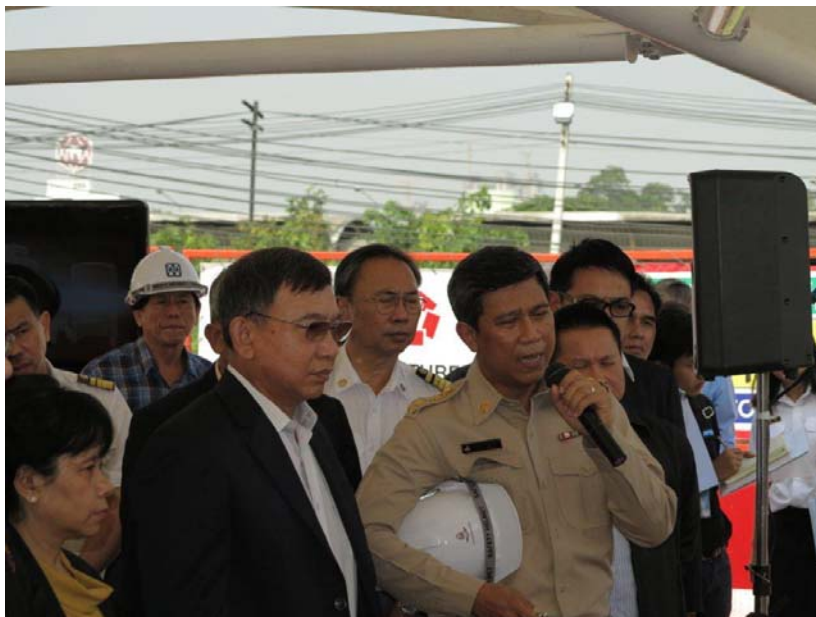
รัฐมนตรีว่าการกระทรวงคมนาคม ปลัดกระทรวงคมนาคม พร้อมคณะ รับฟังการบรรยายการดำเนินการโครงการฯ