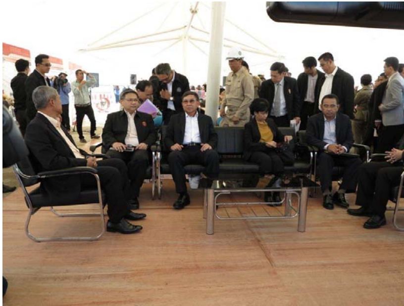
รัฐมนตรีว่าการกระทรวงคมนาคม ปลัดกระทรวงคมนาคม พร้อมคณะ เยี่ยมชมและติดตามการดำเนินการก่อสร้างโครงการระบบรถไฟฟ้าชานเมือง (สายสีแดง) ช่วงบางซื่อ – รังสิต สัญญาที่ 1