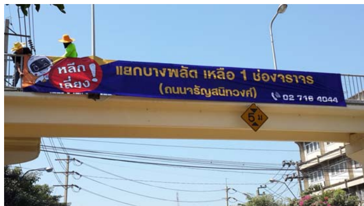
ประชาสัมพันธ์ การจราจรแยกบางพลัด

(4.1) โดยที่ การจราจรชนส่งในกรุงเทพมหานครและปริมณฑล มีปริมาณยานพาหนะมากกว่าถนนหนทางอยู่หลายเท่าตัว ถนนทางหลวงไม่อาจรองรับปริมาณรถยนต์ได้เพียงพอ ส่งผลให้การจราจรติดขัดถึงขั้นวิกฤต ประชาชนได้รับความเดือดร้อน เกิดความสูญเสียจากการเผาไหม้น้ำมันเชื้อเพลิง ส่งผลกระทบต่อสิ่งแวดล้อม สูญเสียรายได้และเพิ่มภาระให้ภาครัฐ ในการนำเข้าน้ำมันเชื้อเพลิง ทำให้ส่งผลกระทบต่อพัฒนาเศรษฐกิจและสังคมของชาติ อีกทั้ง ปัญหาการจราจรที่อยู่ในขั้นวิกฤตนี้เป็นการบั่นทอนสุขภาพจิตของประชาชนอีกด้วย ภาครัฐจึงมีนโยบายเร่งรัดให้มีการก่อสร้างระบบคมนาคมขนส่งมวลชน เพื่อให้ประชาชนได้รับความสะดวกสบาย รวดเร็ว ตรงเวลา ประหยัด และทันสมัย ในการสัญจร เพื่อรองรับการเพิ่มจำนวนของประชากรและปริมาณรถยนต์ที่เพิ่มขึ้นในแต่ละปี การดำเนินการก่อสร้างพื้นฐานขนาดใหญ่ดังกล่าว ย่อมใช้ระยะเวลายาวนาน ดังนั้น บริษัท ยูนิค เอ็นจิเนียริง แอนด์ คอนสตรัคชั่น จำกัด (มหาชน) ร่วมกับองค์กรภาครัฐสนับสนุนส่งเสริมให้มีการประชาสัมพันธ์สภาพการจราจรทางสถานีวิทยุ สวพ.91 เพื่อให้ประชาชนที่ใช้ถนนได้บริโภคข่าวสารข้อมูลที่เป็นจริง และใช้เป็นข้อมูลในการวางแผนการเดินทาง ส่งผลให้ปัญหาการจราจรเบาบางลงไปได้ในระดับหนึ่ง