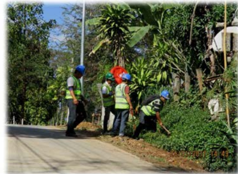
โครงการติดตั้งกระจกบนถนนสาธารณะ โครงการอุโมงค์ส่งน้ำแม่จัด - แม่กวัง จังหวัดเชียงใหม่