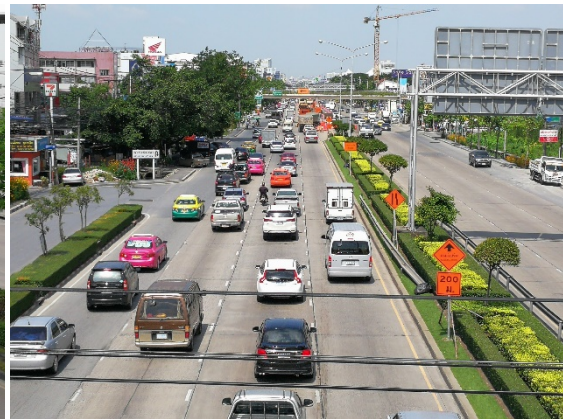
การติดตั้งป้ายจราจรเป็นไปตามมาตรฐาน เพื่อให้ผู้ขับขี่ผ่านพื้นที่โครงการก่อสร้างสามารถสังเกตได้ชัดเจน