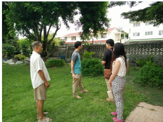
ลงพื้นที่ชี้แจงชาวบ้านตามข้อร้องเรียนและนำมาดำเนินการแก้ไขต่อไป

จัดกิจกรรมมวลชนสัมพันธ์โครงการรถไฟฟ้าสายสีเขียว (เหนือ) สัญญาที่ 2 ตามชุมชนและหน่วยงานต่างตามแนวสายทาง งานก่อสร้างโครงการฯ เช่น ชุมชน กม.24, RTAF, รพ.ภูมิพลอดุลยเดช, โรงเรียนฤทธิยะวรรณาลัย, สภ.คูคต ฯลฯ