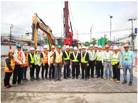
การติดตามตรวจสอบผลการดำเนินการตามมาตรการป้องกันและลดผลกระทบสิ่งแวดล้อมร่วมกับหน่วยงานภาครัฐ