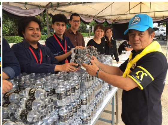
การเข้าร่วมกิจกรรมกับชุมชนและหน่วยงานตามแนวพื้นที่ก่อสร้าง