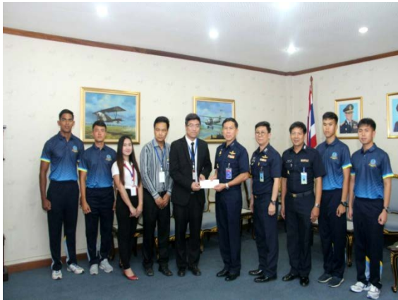
กิจกรรมมอบทุนสนับสนุนในการแข่งขันกีฬาประเพณี ประจำปี 2560 ให้แก่ โรงเรียนนายเรือทหารอากาศ