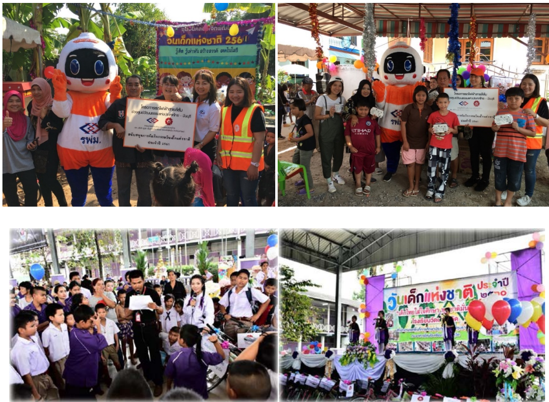
ร่วมกิจกรรมวันเด็กแห่งชาติกับชุมชนโดยรอบแนวพื้นที่ก่อสร้าง