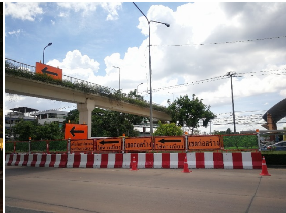
การติดตั้งไฟส่องสว่างและป้ายเตือน ตามแนวก่อสร้างเพื่อป้องกันอุบัติเหตุ