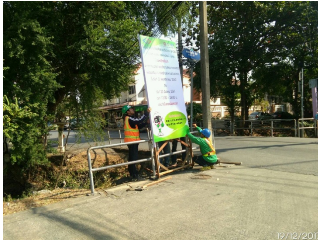
ป้ายประชาสัมพันธ์แจ้งโปรดหลีกเลี่ยงการจราจร เพื่อดำเนินงานก่อสร้างสะพานข้ามคลอง บริเวณคลองสอง