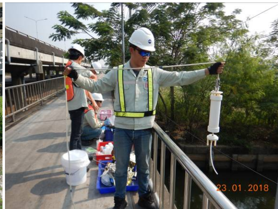
การตรวจวัดคุณภาพสิ่งแวดล้อมระหว่างที่มีกิจกรรมการก่อสร้างโครงการ