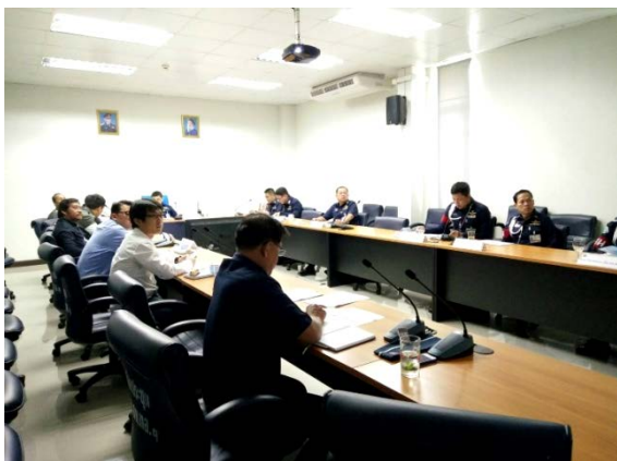
ประชาสัมพันธ์โครงการ เพื่อเข้าพื้นที่ก่อสร้างโครงการฯ ณ RTAF

นอกจากนี้ สำนักงานภาคสนามของโครงการต่างๆ ยังได้ให้การสนับสนุนช่วยเหลืออื่นๆ ที่เป็นประโยชน์ต่อสังคม และชุมชนใกล้เคียงพื้นที่โครงการอีกด้วย เช่น การจัดทำป้ายรถเมล์ชั่วคราว การจัดทำทางและเชื่อมต่อไหล่ทางที่ต่างระดับกันให้มีระดับเสมอกันทำให้ประชาชนที่ใช้พื้นที่ดังกล่าวได้รับความสะดวก และไม่เกิดอันตรายในการใช้ทางระหว่างการก่อสร้าง รวมถึงการทำทางเชื่อมเข้า-ออกให้กับชุมชนใกล้เคียง เพื่อการสัญจรไปมาที่สะดวกยิ่งขึ้นในฤดูฝนสำหรับประชาชนในพื้นที่อีกด้วย เป็นต้น