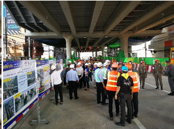
การประสานงานร่วมกับส่วนงานราชการเพื่อป้องกันผลกระทบระหว่างการก่อสร้างและอำนวยความสะดวกให้กับประชาชน