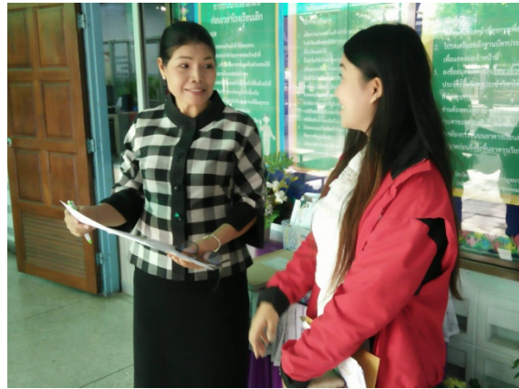
ลงพื้นที่ประชาสัมพันธ์การเข้าพื้นที่ดำเนินการก่อสร้าง และประชาสัมพันธ์โครงการรถไฟฟ้าสายสีเขียว (เหนือ) ส่วนต่อขยายสัญญาที่ 2 ตามสายทางงานก่อสร้าง