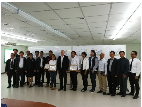
ได้รับมอบประกาศนียบัตรการบริหารจัดการด้านสิ่งแวดล้อม จากการรถไฟฟ้าขนส่งมวลชนแห่งประเทศไทย (รฟม.)