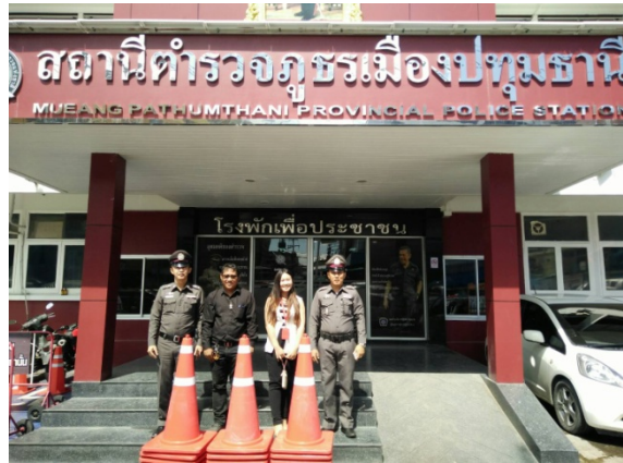
กิจกรรมมอบกรวยยางให้แก่สถานีตำรวจภูธรเมืองปทุมธานี

จัดกิจกรรมมวลชนสัมพันธ์โครงการรถไฟฟ้าสายสีเขียว (เหนือ) สัญญาที่ 2 ตามชุมชนและหน่วยงานต่างตามแนวสายทาง งานก่อสร้างโครงการฯ เช่น ชุมชน กม.24, RTAF, รพ.ภูมิพลอดุลยเดช, โรงเรียนฤทธิยะวรรณาลัย, สก.คูคต ฯลฯ