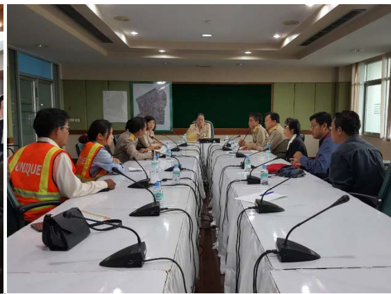
การประชุมร่วมกับหน่วยงานภายในท้องที่ เพื่อชี้แจงรายละเอียดและแผนการก่อสร้างของโครงการ