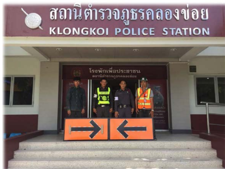
โครงการมอบป้ายจราจรเพื่อความปลอดภัยทางถนนให้ทาง สก.คลองข่อย