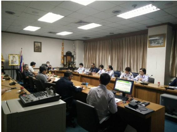
ประชาสัมพันธ์โครงการ เพื่อเข้าพื้นที่ก่อสร้างโครงการฯ ณ รพ.ภูมิพลอดุลยเดช