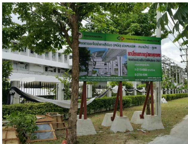
ป้ายประชาสัมพันธ์ ชื่อสถานีและเบอร์ติดต่อสอบถาม

โดยที่ การจราจรขนส่งในกรุงเทพมหานครและปริมณฑล มีปริมาณยานพาหนะมากกว่าถนนหนทางอยู่หลายเท่าตัว ถนนทางหลวงไม่อาจรองรับปริมาณรถยนต์ได้เพียงพอ ส่งผลให้การจราจรติดขัดถึงขั้นวิกฤต ประชาชนได้รับความเดือดร้อน เกิดความสูญเปล่าจากการเผาไหม้น้ำมันเชื้อเพลิง ส่งผลกระทบต่อสิ่งแวดล้อม สูญเสียรายได้ และเพิ่มภาระให้ภาครัฐ ในการนำเข้าน้ำมันเชื้อเพลิง ทำให้ส่งผลกระทบต่อการพัฒนาเศรษฐกิจและสังคมของชาติ อีกทั้ง ปัญหาการจราจรที่อยู่ในขั้นวิกฤตนี้เป็นการบั่นทอนสุขภาพจิตของประชาชนอีกด้วย ภาครัฐจึงมีนโยบายเร่งรัดให้มีการก่อสร้างระบบคมนาคมขนส่งมวลชน เพื่อให้ประชาชนได้รับความสะดวกสบาย รวดเร็ว ตรงเวลา ประหยัด และทันสมัย ในการสัญจร เพื่อรองรับการเพิ่มจำนวนของประชากรและปริมาณรถยนต์ที่เพิ่มขึ้นในแต่ละปี การดำเนินการโครงสร้างพื้นฐานขนาดใหญ่ดังกล่าว ย่อมใช้ระยะเวลายาวนาน ดังนั้น บริษัท ยูนิค เอ็นจิเนียริง แอนด์ คอนสตรัคชั่น จำกัด (มหาชน) ร่วมกับองค์กรภาครัฐสนับสนุนส่งเสริมให้มีการประชาสัมพันธ์สภาพการจราจร ทางสถานีวิทยุ สวพ.91 เพื่อให้ประชาชนที่ใช้ถนนได้บริโภคข่าวสารข้อมูลที่เป็นจริง และใช้เป็นข้อมูลในการวางแผนการเดินทาง ส่งผลให้ปัญหาการจราจรเบาบางลงไปได้ในระดับหนึ่ง