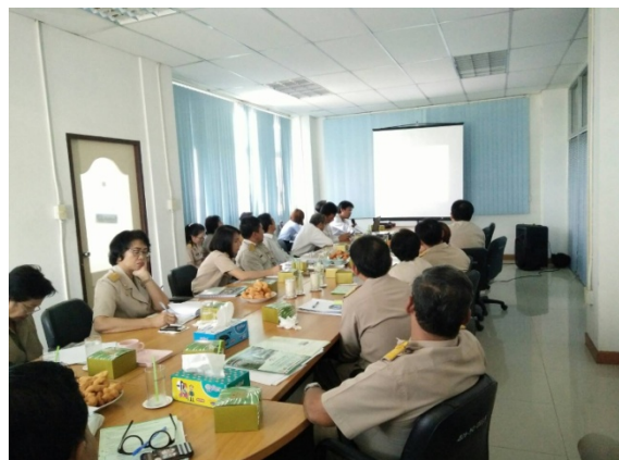
ประชาสัมพันธ์โครงการ เพื่อเข้าพื้นที่ก่อสร้างโครงการฯ ณ สำนักงานเทศบาลคูคต

ประชาสัมพันธ์โครงการรถไฟฟ้าสายสีเขียว (เหนือ) ส่วนต่อขยาย สัญญาที่ 2 เพื่อเข้าพื้นที่ก่อสร้างโครงการฯ ตามสายทางงานก่อสร้างและหน่วยงานที่เกี่ยวข้อง