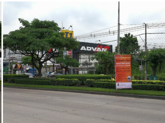
การติดตั้งป้ายประชาสัมพันธ์เพื่อให้ประชาชนรับทราบข้อมูลโครงการล่วงหน้า