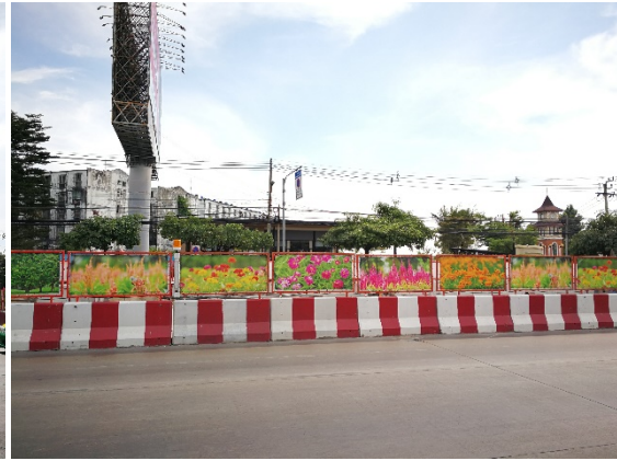
การลดผลกระทบด้านทัศนียภาพตามแนวพื้นที่ก่อสร้าง โดยการติดตั้งผ้าใบพิมพลวดลายต้นไม้ และดอกไม้ตามธรรมชาติ