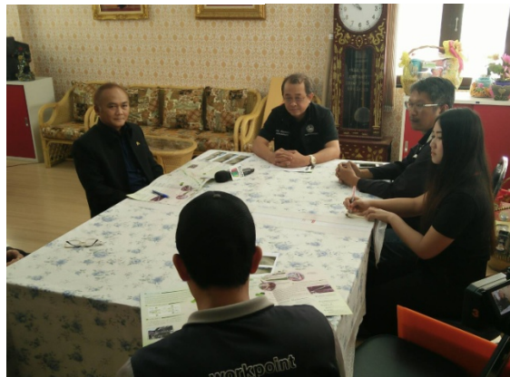
ประชาสัมพันธ์โครงการ เพื่อเข้าพื้นที่ก่อสร้างโครงการฯ ณ ที่ว่าการอำเภอ ลำลูกกา

ประชาสัมพันธ์โครงการรถไฟฟ้าสายสีเขียว (เหนือ) ส่วนต่อขยาย สัญญาที่ 2 เพื่อเข้าพื้นที่ก่อสร้างโครงการฯ ตามสายทาง งานก่อสร้างและหน่วยงานที่เกี่ยวข้อง