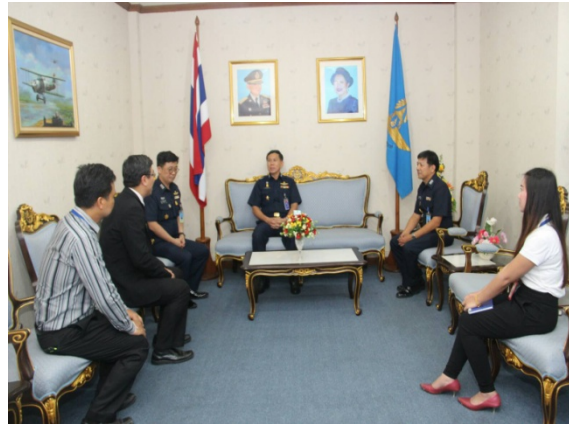
ประชาสัมพันธ์โครงการ เพื่อเข้าพื้นที่ก่อสร้างโครงการฯ ณ โรงเรียนนายเรืออากาศ