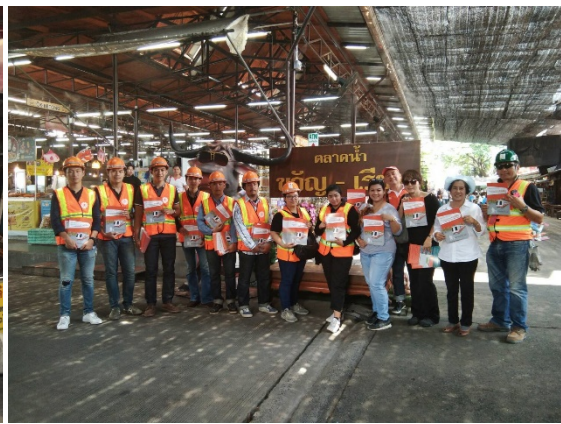
การลงพื้นที่ประชาสัมพันธ์ยังชุมชนและสถานที่สำคัญตามแนวพื้นที่ก่อสร้าง