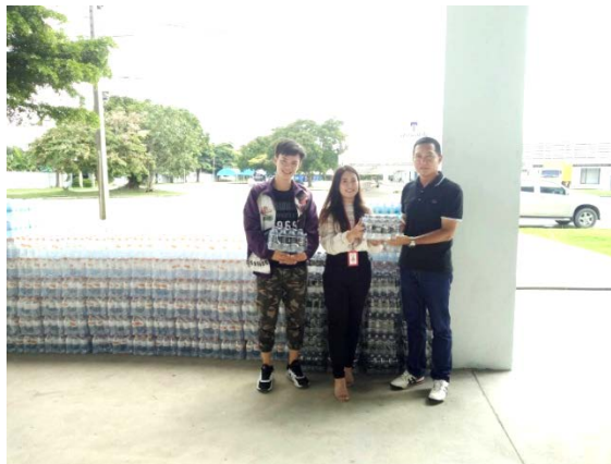
กิจกรรมมอบน้ำดื่มให้กับ ทอ. เพื่อแจกผู้เข้าร่วมในพระราชพิธีถวายพระ เพลิงพระบรมศพ ณ สนามกีฬาธูปะเตมีย์

จัดกิจกรรมมวลชนสัมพันธ์โครงการรถไฟฟ้าสายสีเขียว (เหนือ) สัญญาที่ 2 ตามชุมชนและหน่วยงานต่างตามแนวสายทาง งานก่อสร้างโครงการฯ เช่น ชุมชน กม.24, RTAF, รพ.ภูมิพลอดุลยเดช, โรงเรียนฤทธิยะวรรณาลัย, สก.คูคต ฯลฯ