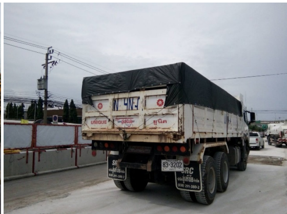
การปฏิบัติตามมาตรการการป้องกันและลดผลกระทบสิ่งแวดล้อมระหว่างที่มีกิจกรรมการก่อสร้าง