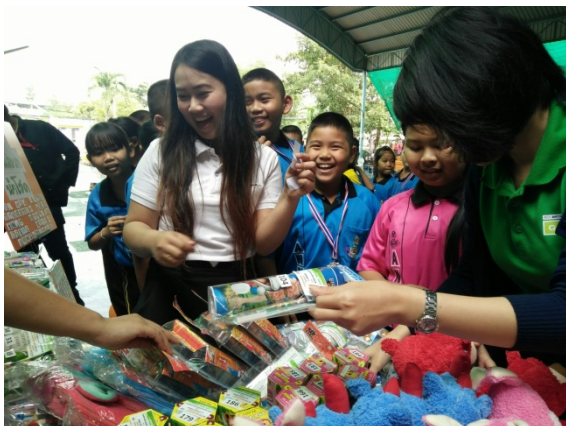
กิจกรรมวันเด็กแห่งชาติประจำปี 2561 ณ โรงเรียนแอนนิกซ์

จัดกิจกรรมมวลชนสัมพันธ์โครงการรถไฟฟ้าสายสีเขียว (เหนือ) สัญญาที่ 2 ตามชุมชนและหน่วยงานต่างตามแนวสายทาง งานก่อสร้างโครงการฯ เช่น ชุมชน กม.24, RTAF, รพ.ภูมิพลอดุลยเดช, โรงเรียนฤทธิยะวรรณาลัย, สภ.คูคต ฯลฯ