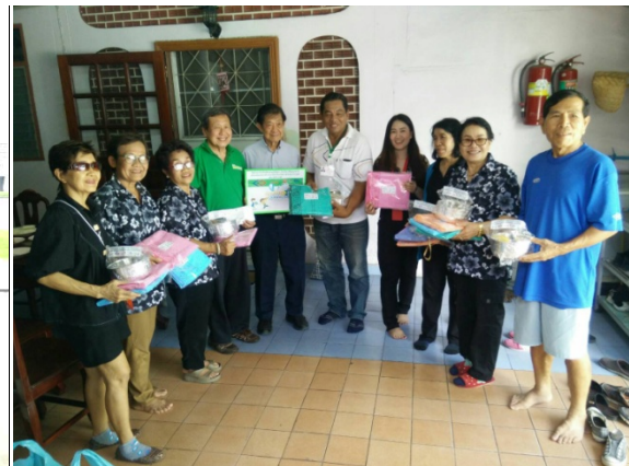
กิจกรรมมอบของช่วยเหลือเนื่องในเทศกาลวันสงกรานต์ ณ ชุมชนแอนเน็กซ์

จัดกิจกรรมมวลชนสัมพันธ์โครงการรถไฟฟ้าสายสีเขียว (เหนือ) สัญญาที่ 2 ตามชุมชน และหน่วยงานต่างตามแนวสายทางงานก่อสร้างโครงการฯ เช่น ชุมชน กม.24, RTAF, รพ.ภูมิพลอดุลยเดช, โรงเรียนฤทธิยะวรรณาลัย, สก.คูคต ฯลฯ