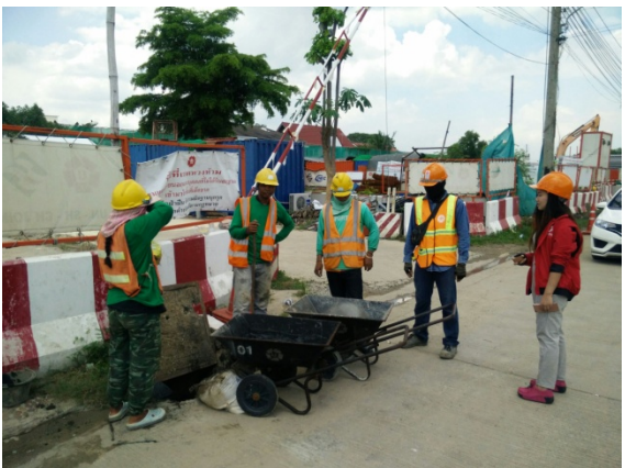
กิจกรรมล่อท่ระบายน้ำ ณ ชุมชนกม.25