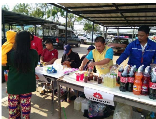
กิจกรรมงานวันเด็ก อบต.นนทรี ต.นนทรี อ.กบินทร์บุรี จ.ปราจีนบุรี

สำหรับปัญหาสิ่งแวดล้อมของไทยนั้น ล้วนมาจากเหตุปัจจัยหลายประการ เช่น การเพิ่มขึ้นของประชากร ส่งผลให้มีการใช้และการบริโภคทรัพยากรมากขึ้น นอกจากนั้นความเจริญก้าวหน้าทางวิทยาศาสตร์และเทคโนโลยี เป็นผลให้เกิดกระบวนการผลิตทางอุตสาหกรรม ซึ่งกระบวนการเหล่านี้ก่อให้เกิดการเปลี่ยนแปลงคือ ทรัพยากรธรรมชาติ เช่น ป่าไม้ แร่ธาตุ ถูกนำมาเป็นวัตถุดิบในกระบวนการผลิตเป็นจำนวนมาก ขณะเดียวกันก็ ก่อให้เกิดมลพิษจากกระบวนการผลิตถูกปลดปล่อยออกมาสู่สิ่งแวดล้อมด้วย กลไกในการสร้างลักษณะนิสัยอันที่เป็น ที่ยอมรับว่าจะสามารถคงทนและอยู่ได้นานในจิตของมนุษย์เราเรียกว่า การสร้างให้เกิด “ความตระหนักใน สิ่งแวดล้อม” โดยทางบริษัทได้ส่งเสริมการให้ความรู้และฝึกอบรม โดยผ่านเวทีการประชุม และการปฏิบัติงานจริงใน โครงการก่อสร้างทุกโครงการของบริษัท โดยการใช้ทรัพยากรให้เกิดประสิทธิภาพสูงสุด เช่น การก่อสร้างโดยใช้แบบ หล่อที่ทำจากเหล็กไม่ใช่ไม้ การหมุนเวียนการใช้น้ำ การสร้างระบบบำบัดน้ำเสียภายในโรงงานผลิตชิ้นส่วนคอนกรีต สำเร็จรูป การบริหารการใช้โครงสร้างชั่วคราว (Temporary Structure) ระหว่างโครงการ เป็นต้น