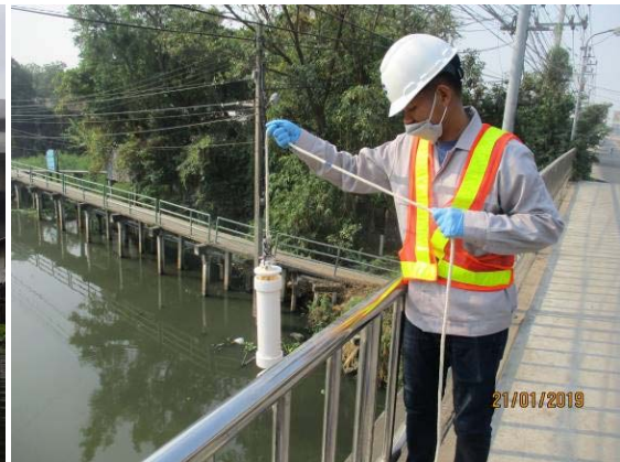
การตรวจวัดคุณภาพสิ่งแวดล้อมในด้านคุณภาพน้ำ ทั้งระยะก่อนก่อสร้าง และระหว่างที่มีกิจกรรมการก่อสร้างโครงการ