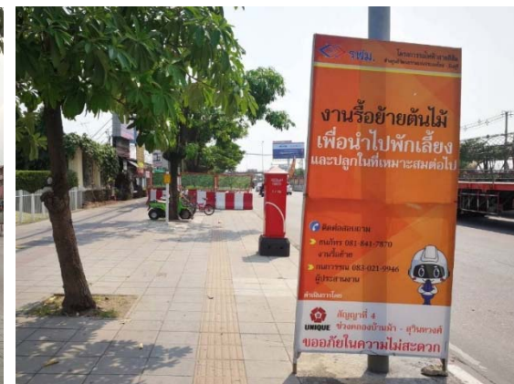
การติดตั้งป้ายประชาสัมพันธ์เพื่อให้ประชาชนรับทราบข้อมูลโครงการ