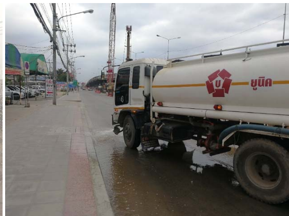
การปฏิบัติตามมาตรการการป้องกันและลดผลกระทบสิ่งแวดล้อมระหว่างที่มีกิจกรรมการก่อสร้าง เรื่องการควบคุมฝุ่นละออง