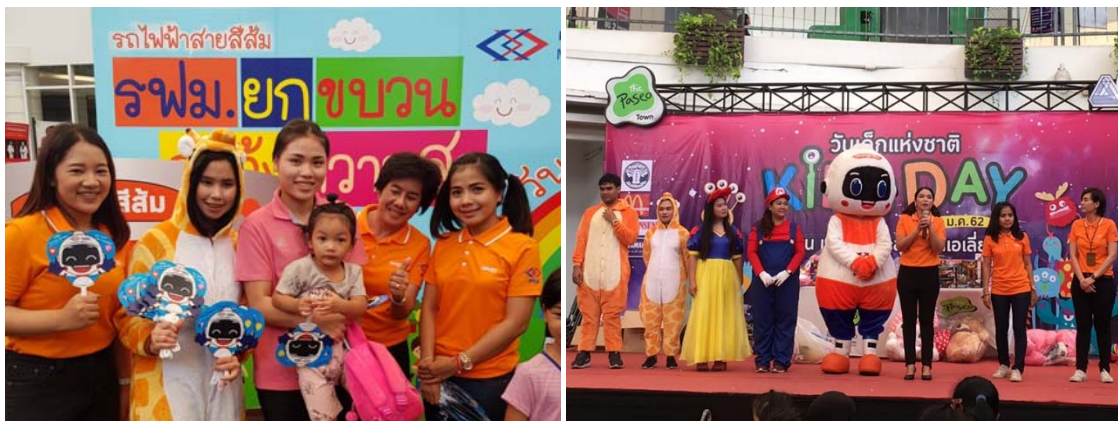
ร่วมกิจกรรมวันเด็กแห่งชาติกับชุมชนโดยรอบแนวพื้นที่ก่อสร้าง