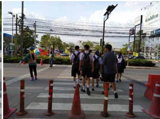
การจัดเจ้าหน้าที่อาสาจราจรคอยอำนวยความสะดวกให้กับประชาชน