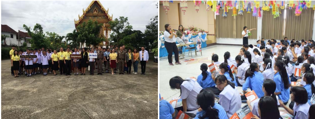
การเข้าร่วมกิจกรรมกับชุมชนและหน่วยงานตามแนวพื้นที่ก่อสร้าง