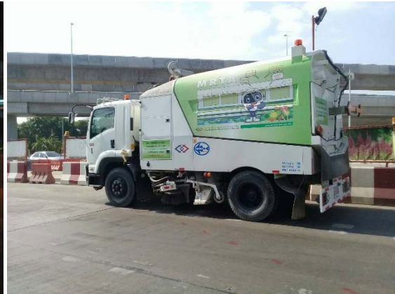
การใช้รถกวาดดูดฝุ่นทำความสะอาดถนนสาธารณะตลอดแนวพื้นที่โครงการ