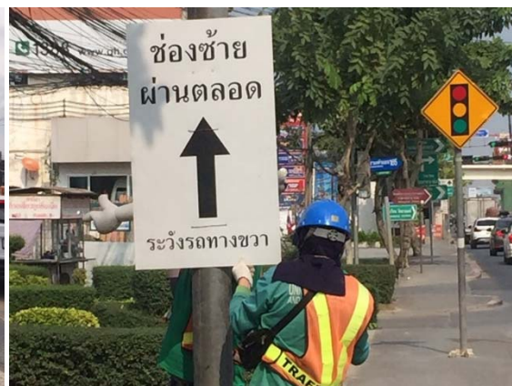
การติดตั้งป้ายเตือนจราจรเพื่อให้ประชาชนได้รับทราบล่วงหน้า