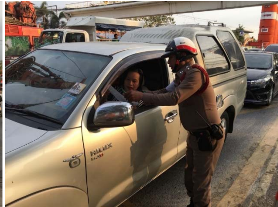
การจัดกิจกรรมรณรงค์ด้านการจราจรร่วมกับตำรวจจราจรท้องที่