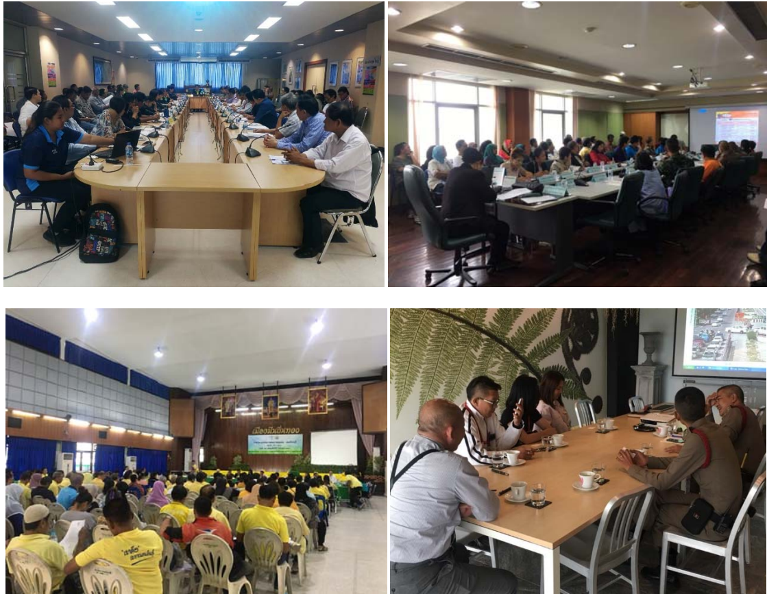
การประสานงานร่วมกับส่วนงานราชการเพื่อป้องกันผลกระทบระหว่างการก่อสร้างและอำนวยความสะดวกให้กับประชาชน

(2) การจัดกิจกรรมด้านมวลชนสัมพันธ์และการมีส่วนร่วมของชุมชน รวมถึงการเพิ่มช่องทางการรับเรื่องร้องเรียนจากผู้ที่มีส่วนได้ส่วนเสีย