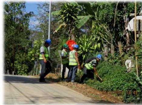
โครงการติดตั้งกระจกบนถนนสาธารณะ ณ โครงการอุโมงค์ส่งน้ำแม่จืด - แม่กวัง จังหวัดเชียงใหม่