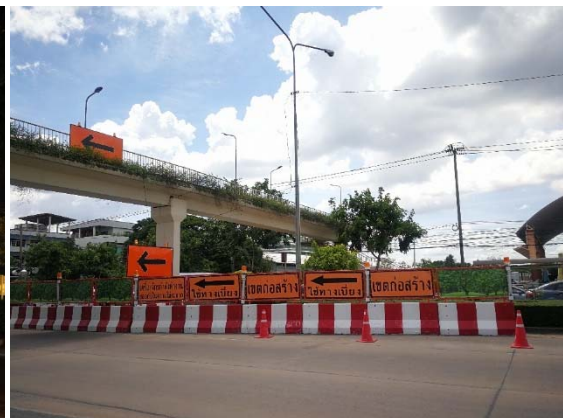
การติดตั้งไฟส่องสว่างและป้ายเตือน ตามแนวก่อสร้างเพื่อป้องกันอุบัติเหตุ