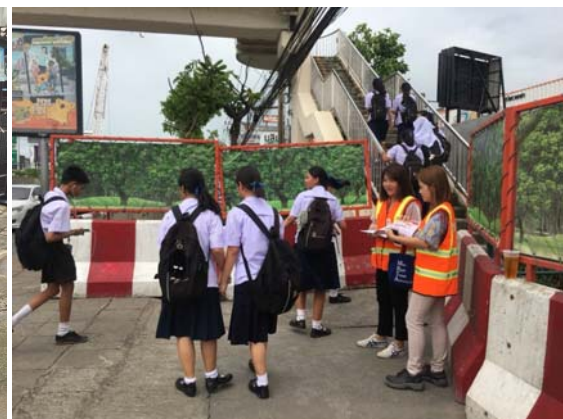
ประชาสัมพันธ์การก่อสร้างโครงการรถไฟฟ้าสายสีเขียว (เหนือ) และรถไฟฟ้าสายสีส้ม (ตะวันออก) ตามแนวสายทางต่อประชาชนและหน่วยงานที่เกี่ยวข้อง