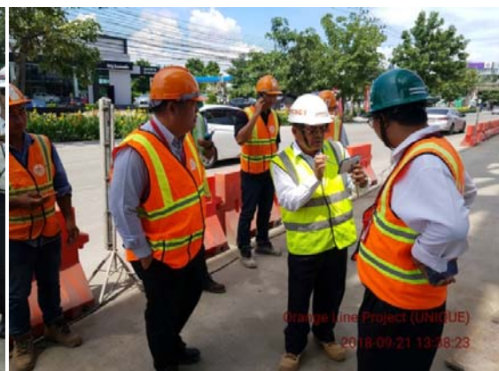
การติดตามตรวจสอบผลการดำเนินการตามมาตรการป้องกันและลดผลกระทบสิ่งแวดล้อมร่วมกับหน่วยงานภาครัฐ