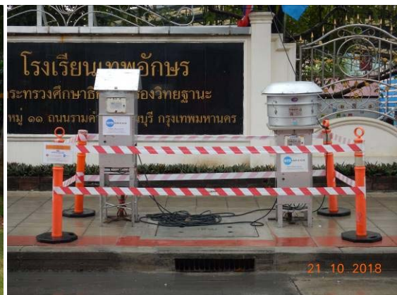
การตรวจวัดคุณภาพสิ่งแวดล้อม ในด้านคุณภาพอากาศทั้งระยะก่อนก่อสร้างและระหว่างที่มีกิจกรรมการก่อสร้างโครงการ