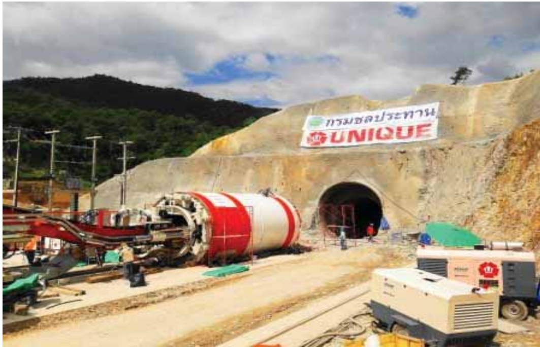
โครงการถนนวงแหวนอุตสาหกรรม สัญญาที่ 3