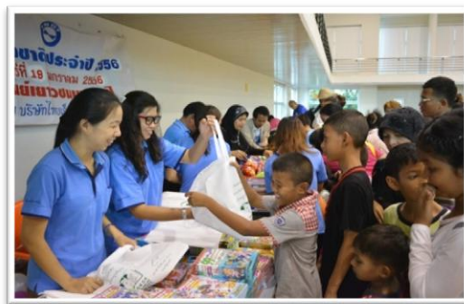
ร่วมงานและสนับสนุนกิจกรรมวันเด็ก ณ ศูนย์เยาวชนบางกะปิ สำนักงาน กรุงเทพฯ

1.3 เสริมสร้างความสุขด้วยการร่วมงานและสนับสนุนกิจกรรมประจำชุมชน หรือท้องถิ่น เช่น กิจกรรมวันเด็ก การทำบุญ และทุกกิจกรรมตามโอกาสที่เหมาะสม เป็นต้น