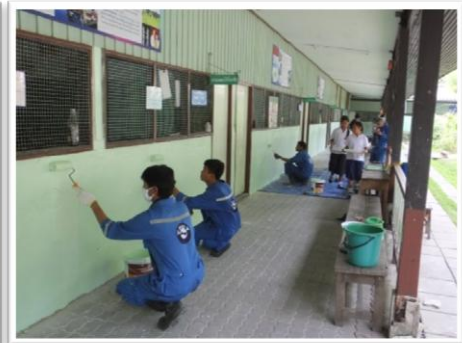
ขัดสีเก่า ทาสีรองพื้น ทาสีเขียว และเก็บรายละเอียด