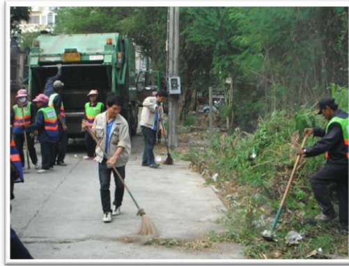
ร่วมกันทำความสะอาดชุมชนโดยรอบ สำนักงานใหญ่ กรุงเทพฯ