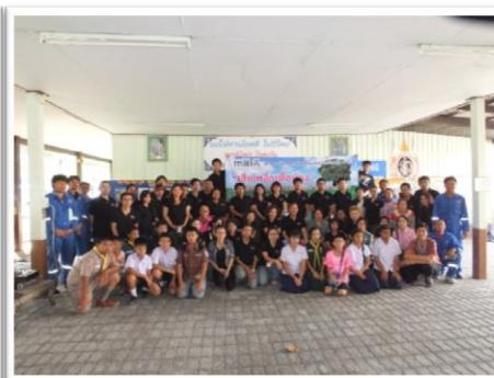
ส่วนหนึ่งของหนังสือวรรณคดีการ์ตูนและหนังสือเรียนจำนวน 350 เล่ม และผู้เข้าร่วมกิจกรรม CSR maiA