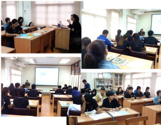
อบรมประกันสังคม ณ สำนักงานใหญ่