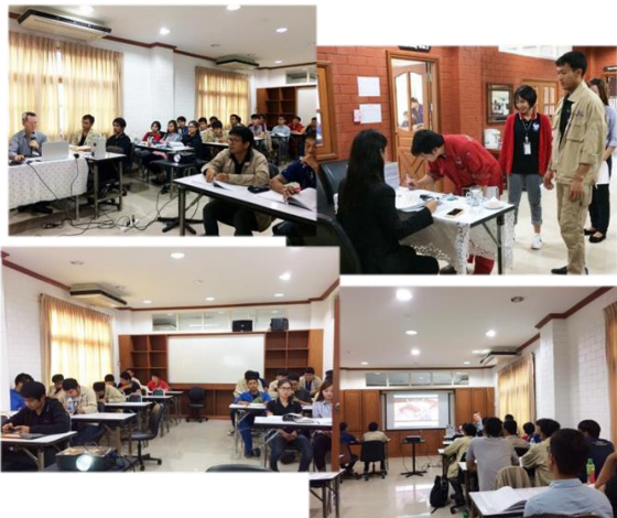
อบรม จป. หัวหน้างาน