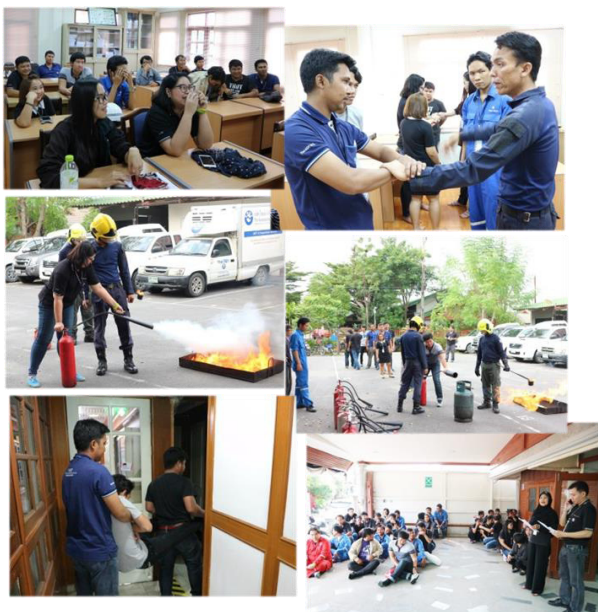
อบรมดับเพลิง และอพยพหนีไฟ ณ สำนักงานกรุงเทพฯ