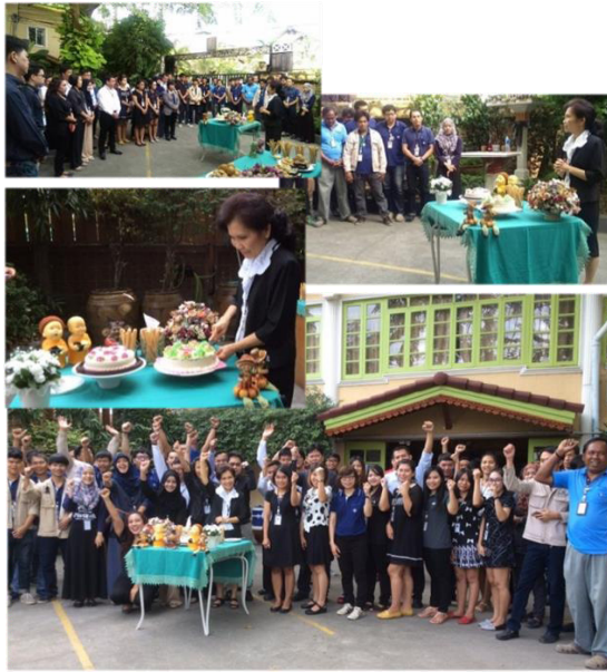
งานรับพรปีใหม่ ณ สำนักงานใหญ่