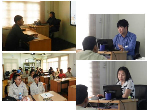
Orientation For New Employee