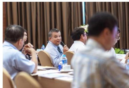
การประชุมสามัญผู้ถือหุ้นประจำปี 2561