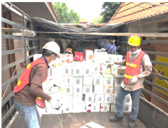
กำจัดสิ่งปฏิกูลหรือวัสดุที่ไม่ใช้แล้ว

ในปี 2561 บริษัทฯ ได้ดำเนินการส่งกากสารกัมมันตภาพรังสีที่เหลือจากการใช้งานรวมทั้งสิ้น 51 เม็ด คืนให้แก่ผู้ผลิตในต่างประเทศ รวมถึงเศษวัสดุ น้ำยาที่ปนเปื้อนสารเคมี และน้ำมันจากการใช้งานเป็นจำนวน 2.14 ตัน ส่งให้กับบริษัท โปรเฟสชั่นแนล เวสต์ เทคโนโลยี (1999) จำกัด (มหาชน) ซึ่งเป็นบริษัทรับกำจัดสิ่งปฏิกูลหรือวัสดุที่ไม่ใช้แล้วทั้งที่เป็นอันตราย และไม่ใช่อันตราย และบำบัดน้ำเสียทุกประเภทจากโรงงานต่างๆ โดยการอนุญาตอย่างถูกต้องจากกระทรวงอุตสาหกรรม เพื่อดำเนินการกำจัดตามหลักวิชาการและข้อกำหนดตามข้อตกลงต่อไป ซึ่งได้รายงานไว้ในแบบแสดงรายการข้อมูลประจำปี 2561 ส่วนที่ 2 หมวดที่ 10 หน้า 94 รายงานประจำปี 2561 หัวข้อ “ความรับผิดชอบต่อชุมชน สังคม และสิ่งแวดล้อมขององค์กร” หน้า 95 และ SD Report บนเว็บไซต์ www.tndt.co.th ของบริษัทฯ หน้า “พัฒนาสู่ความยั่งยืน” หัวข้อ “ความรับผิดชอบต่อชุมชน” หัวข้อย่อย “รายงานความยั่งยืน”