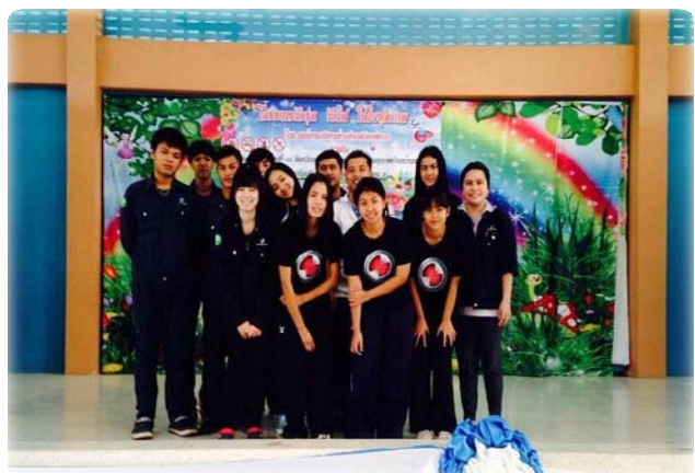
ที่มา : โครงการวัยรุ่น วัยใส ใส่ใจสุขภาพ

โครงการวัยรุ่น วัยใส ใส่ใจสุขภาพ บริษัทได้เข้าไปมีส่วนร่วมในการแนะแนวการศึกษาให้ความรู้เกี่ยวกับการเลือกศึกษาต่อเพื่อจะนำมาประกอบอาชีพในอนาคตที่เป็นที่ต้องการในขณะนี้ และส่งเสริมให้เด็กเรียนรู้ตามความสนใจ และความถนัดของตนเอง ร่วมส่งเสริมให้เด็กมีสังคมและสร้างสัมพันธภาพที่ดีกับผู้อื่น จากการเรียนร่วมกับเพื่อน และผู้อื่น ทั้งนี้สิ่งสำคัญที่ควร