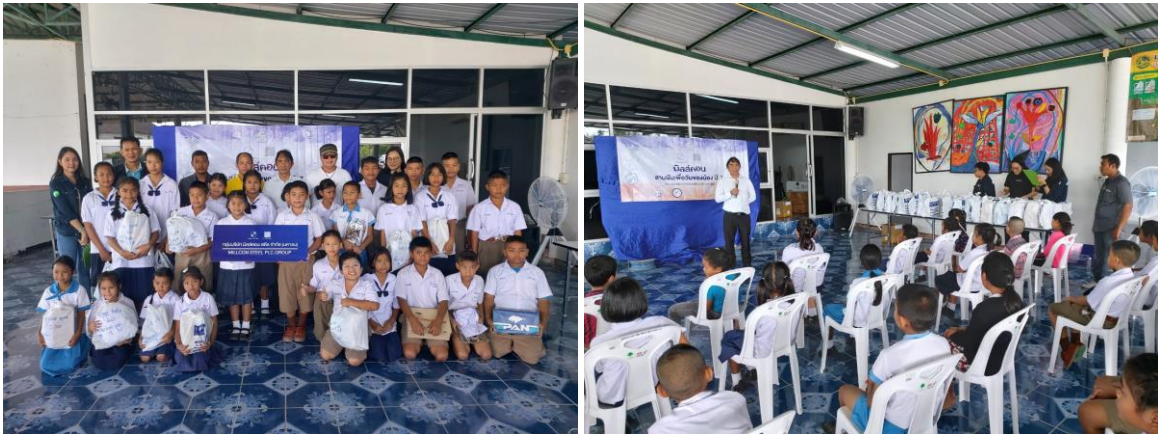
กลุ่มบริษัท มิลล์คอน สตีล จำกัด (มหาชน) มอบเครื่องฉายโปรเจคเตอร์ กับโรงเรียนวัดชากผักกูด เพื่อใช้สำหรับสื่อการเรียนการสอนและทำกิจกรรมส่วนรวมของโรงเรียน