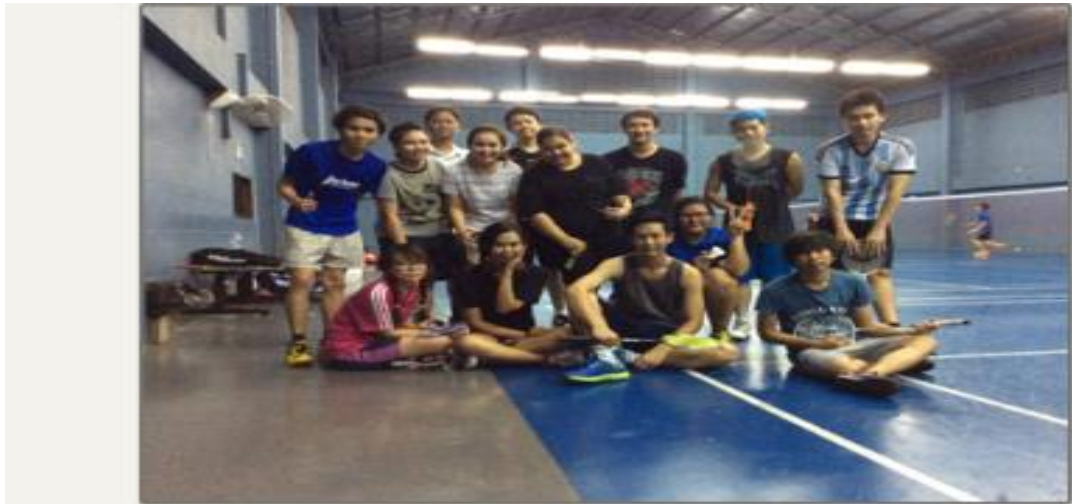
สนามเบดมินตัน ล้วนเล่นเล่น

ชมรมเบดมินตัน : เอเชียซอฟท์ตั้งชมรมเบดมินตันขึ้นเพื่อให้พนักงานมีสุขภาพที่ดีจากการออกกำลังกาย และยังเป็นการทำกิจกรรมดี ๆ ร่วมกันหลังเลิกงานอีกด้วย