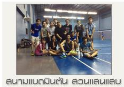
สนามแบดมินตัน ล้วนเล่นเลย

ชมรมแบดมินตัน โยคะ และเต้นซุมบา : เอเชียซอฟท์ตั้งชมรมแบดมินตัน กิจกรรมโยคะ และการเต้นซุมบาขึ้น เพื่อให้พนักงานมีสุขภาพที่ดีจากการออกกำลังกาย อีกทั้งยังเป็นการทำกิจกรรมดี ๆ ร่วมกันหลังเลิกงาน