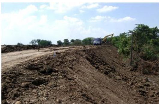
ก่อสร้างคันดินสูง 5 เมตรครึ่ง

ภาพประกอบคลังสินค้า โรงคัดแยกและท่าเรือ สาขาอำเภอนครหลวง จังหวัดพระนครศรีอยุธยา