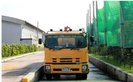
บ่อล้างรถประตูเข้า - ออก