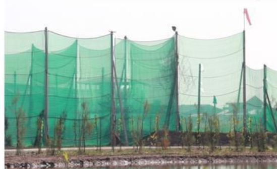
สแลนโถงรอบโรงงาน