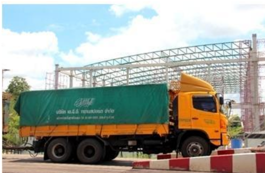
ผ้าใบปิดคลุมรถบรรทุก