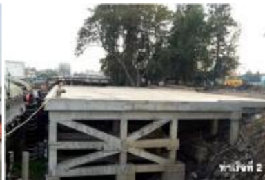
ท่าเรือที่ 2