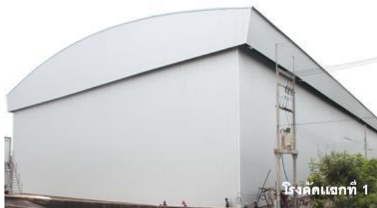
โรงคัดแยกที่ 1