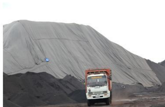
ผ้าใบปิดคลุมกองถ่านหิน