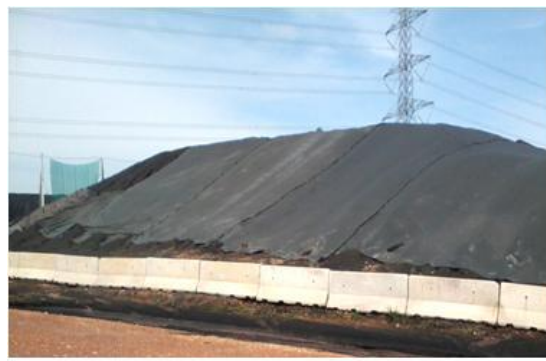
ลาดกองถ่านหิน

ทั้งนี้ บริษัทได้เข้าร่วมโครงการการพัฒนาโรงงานอุตสาหกรรมให้มีความรับผิดชอบต่อสังคม อย่างมีส่วนร่วม (Corporate Social Responsibility, Department of Industrial Works : CSR-DIW) ซึ่งเป็นโครงการที่ส่งเสริมให้ผู้ประกอบการโรงงานอุตสาหกรรมทุกขนาดให้ดำเนินการตามมาตรฐานของกรมโรงงานอุตสาหกรรม ในเรื่องความรับผิดชอบต่อผู้ประกอบการอุตสาหกรรมต่อสังคม การสร้างเครือข่ายในการทำกิจกรรมเพื่อสังคมและชุมชนอย่างมีคุณภาพ มีการแลกเปลี่ยนความรู้ ประสบการณ์ ความชำนาญการ มุ่งไปสู่การพัฒนาอย่างยั่งยืนและเป็นการเตรียมความพร้อมให้กับภาคอุตสาหกรรมของประเทศที่จะเข้าสู่ประชาคมอาเซียนหรือ AEC ซึ่งจะเกิดขึ้นในปี 2558 ให้สามารถปรับตัวสู่มาตรฐานระหว่างประเทศ ว่าด้วยความรับผิดชอบต่อสังคมอย่างเป็นระบบและสามารถรักษาเสถียรภาพทางเศรษฐกิจและสร้างระบบการแข่งขันเสรีที่เป็นธรรมให้ประเทศไทย มีความคิดสร้างสรรค์และเป็นมิตรกับสิ่งแวดล้อมในภูมิภาคอาเซียน ซึ่งตรงกับยุทธศาสตร์การพัฒนา ยุทธศาสตร์ที่ 4 ในร่างแผนการพัฒนาเศรษฐกิจและสังคมแห่งชาติ ฉบับที่ 11 (พ.ศ. 2555-2559)