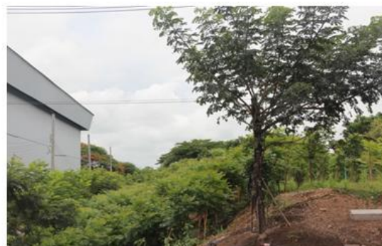
ปลูกต้นไม้บนคันดินกว่า 20,000 ต้น