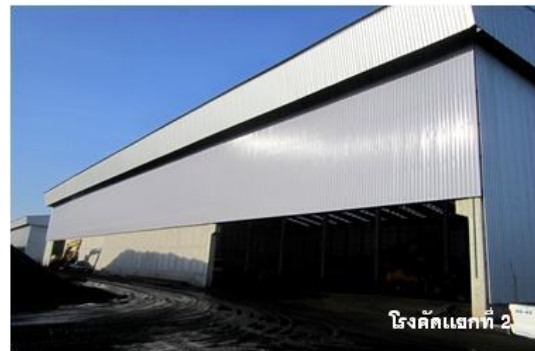
โรงคัดแยกที่ 2