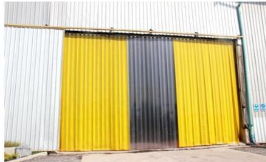
ทางทะเลสตักประตูเข้า - ออก พร้อมประตูน้ำ 3 จุด