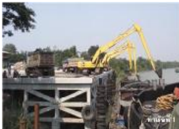
ท่าเรือที่ 1