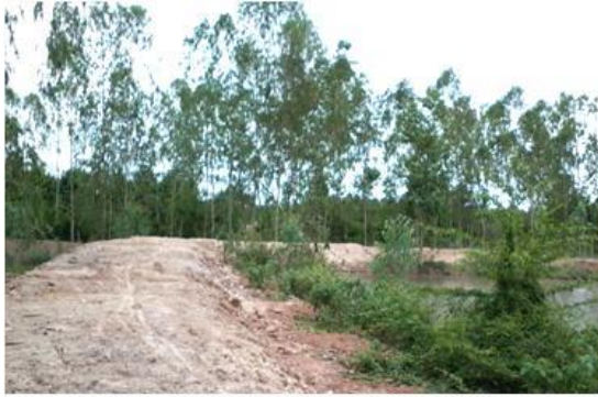
ปลูกต้นไม้โคจรอบ