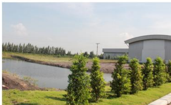
บ่อพักน้ำ