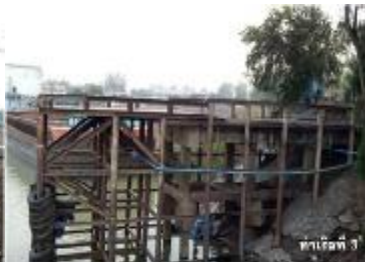
ท่าเรือที่ 3