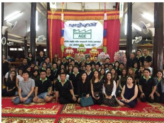
ตุลาคม 2560 ร่วมเป็นเจ้าภาพทอดกฐินสามัคคี 2560 ณ วัดปรีดา ราม ตำบลแม่ลา อำเภอนครหลวง จังหวัดพระนครศรีอยุธยา