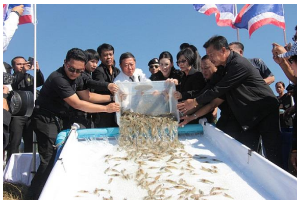
พฤษภาคม 2560 ร่วมสนับสนุนทำกิจกรรมปล่อยพันธุ์สัตว์น้ำ (กึ่ง გამრამ) ณ วัดจันทร์ อำเภอนครหลวง จังหวัดพระนครศรีอยุธยา