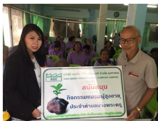
มีนาคม 2560 ร่วมสนับสนุนกิจกรรมผู้สูงอายุตำบลแม่ลา และตำบลบางพระครู อำเภอนครหลวง จังหวัดพระนครศรีอยุธยา