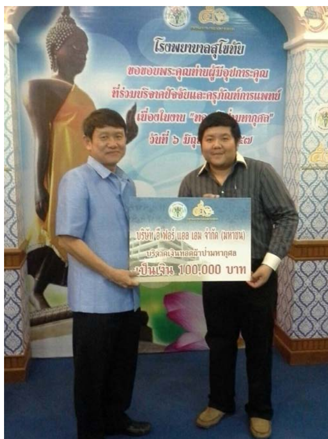
ร่วมบริจาคการทอดผ้าป่าเพื่อครุภัณฑ์ทางการแพทย์ รพ.สุโขทัย – 3 มิ.ย.57