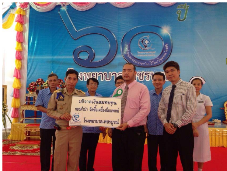
บริจาคสมทบทุนกองผ้าป่าซื้อเครื่องมือแพทย์ รพ.เพชรบูรณ์ - 25 มิถุนายน