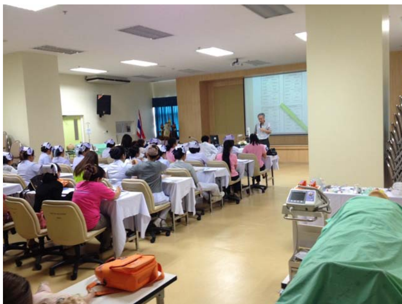
บรรยายภาคการอบรมในโครงการ CPR โรงพยาบาลปทุมธานี – เม.ย.57