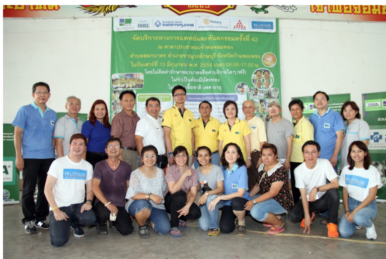
สนับสนุนการปฏิบัติงานหน่วยแพทย์และทันตแพทย์เคลื่อนที่ ครั้งที่ 42 – 13 มิถุนายน.