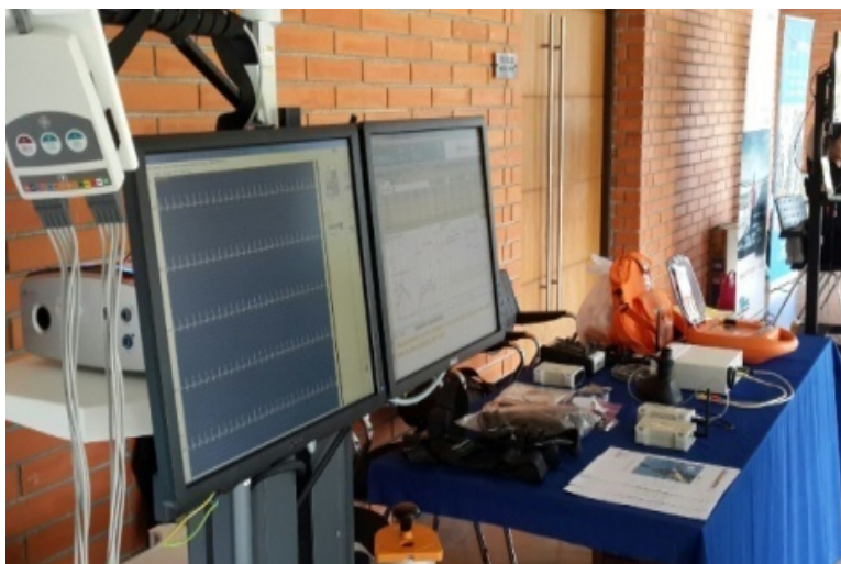
30 th Anniversary, Sports Science, Mahidol University มหาวิทยาลัย มหิดล วิทยาเขตศาลายา – 23 กรกฎาคม.