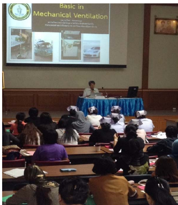
อบรมการใช้งานเครื่องช่วยหายใจ โรงพยาบาลหาดใหญ่