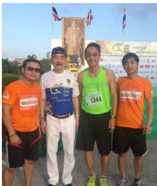
ราชพฤกษ์มินิมาราธอน

รวม 23 ครั้ง เช่น โรงพยาบาลธรรมศาสตร์, พระจอมเกล้า, สมเด็จพระพุทธเลิศหล้า, สมุทรสาคร, ระยอง, พหลพลพยุหเสนา, บ้านโป่ง, โรคทรวงอก, เจ้าคุณไพบูรณ์, สระบุรี, สมเด็จพระนาราย, อานันทมหิดล, วชิระ, พิจิตร, แกลง, สิริธร, หัวหิน, สุโขทัย, ไทรโยค และ รพ.เพชรบูรณ์