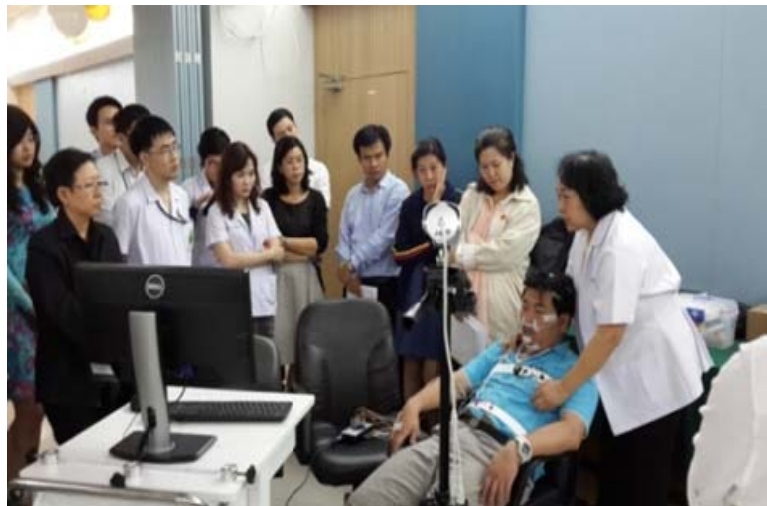
Workshop ด้าน Sleep Lab และ Pulmonary Function ที่สมาคมอูรเวชแห่งประเทศไทย โรงพยาบาลพระมงกุฎเกล้า – 21 มกราคม.