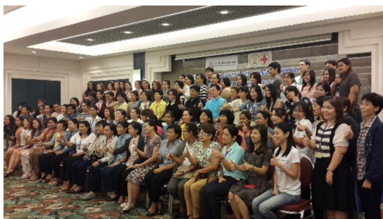
จัด Road Show ประชุมวิชาการ การจัดอบรมดูแลรักษาเครื่อง การใช้งานแสดงสินค้าใน โรงพยาบาล หลัก เช่น โรงพยาบาลจุฬาฯ, สถาบันสุขภาพเด็กฯ, กรุงเทพฯ, มศว.