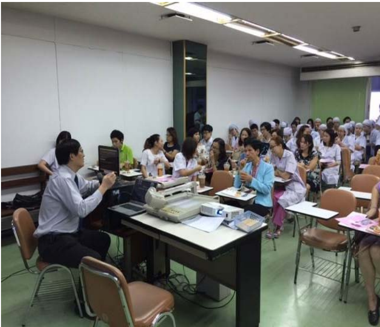
โรงพยาบาลราชวิถี – จัดประชุมวิชาการเครื่องดมยาสลบ Avance CS2.