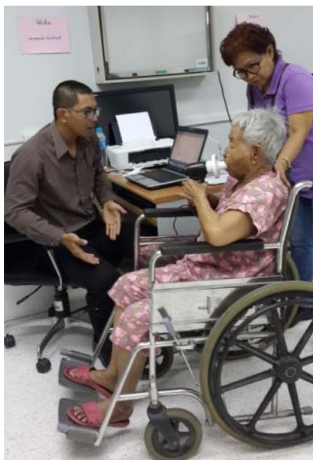
Road Show Spirometer with AstraZaneca.

รวม 23 ครั้ง เช่น โรงพยาบาลธรรมศาสตร์, พระจอมเกล้า, สมเด็จพระพุทธเลิศหล้า, สมุทรสาคร, ระยอง, พหลพลพยุหเสนา, บ้านโป่ง, โรคทรวงอก, เจ้าคุณไพบูรณ์, สระบุรี, สมเด็จพระนาราย, อานันทมหิดล, วชิระ, พิจิตร, แกลง, สิริธร, หัวหิน, สุโขทัย, ไทรโยค และ รพ.เพชรบูรณ์