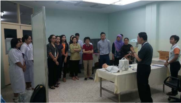
สถาบันสุขภาพเด็ก.