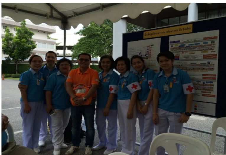
Bike for Mom at Chiang Mai – สิงหาคม