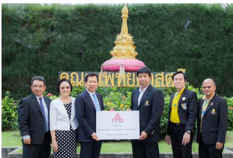
ร่วมบริจาคโครงการสนับสนุนการจัดการรับรางวัลผู้พิชิตร่างกายเพื่อการศึกษาของศูนย์ฝึกผ่ตัด จุฬาลงกรณ์มหาวิทยาลัย – 4 ธันวาคม