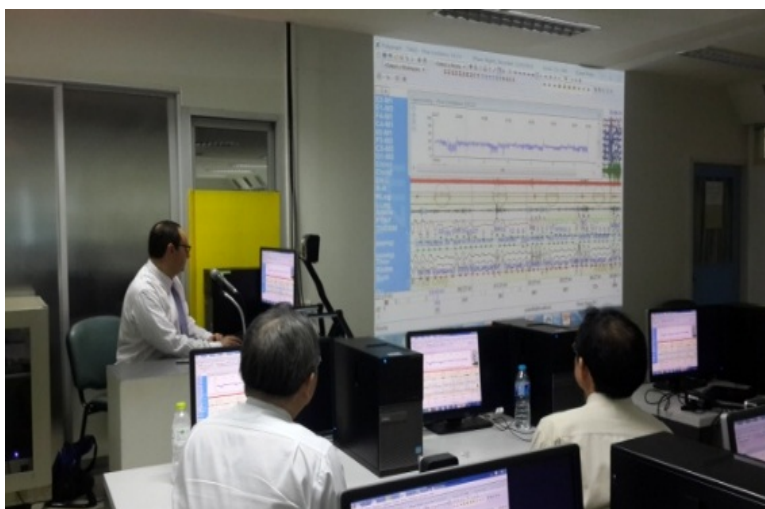
Seminar “Polysmith Sleep Analysis System Update in Sleep Lab 2015”