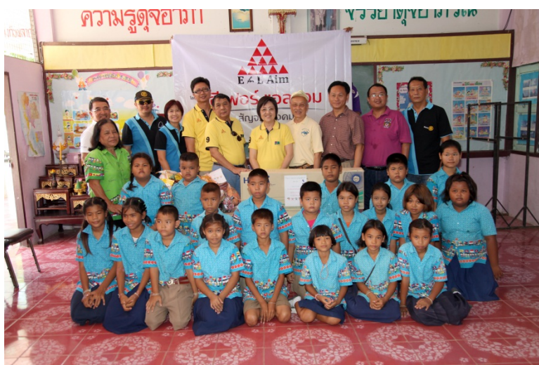
บริจาคทุนการศึกษาและอุปกรณ์การเรียน โครงการสัญจรสู่สังคม EFORL – 12 มิถุนายน