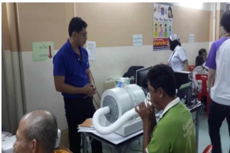
โครงการหน่วยแพทย์อาสาเฉพาะทางร่วมใจเฉลิมพระเกียรติฯ ที่ โรงพยาบาลพลพลพยุหเสนา จ.กาญจนบุรี – 12 กันยายน