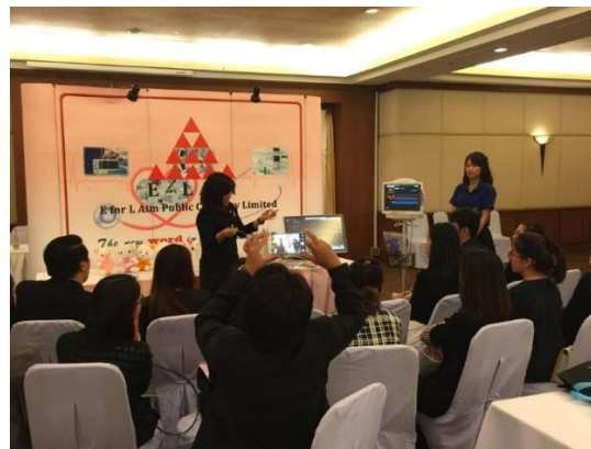
(5). ร่วมสนับสนุนการจัดประชุมวิชาการเชิงปฏิบัติการ One Day Critical Care ในหัวข้อ ICU Monitoring ร่วมกับชมรมพยาบาลผู้ป่วยวิกฤตแห่งประเทศไทย เชียงใหม่ – 23-26 มีนาคม.