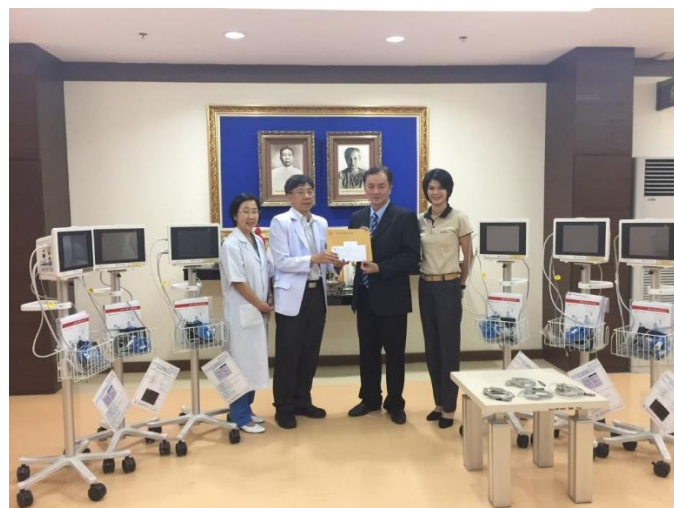
(8). บริษัทได้บริจาคเครื่องติดตามการทำงานของหัวใจและสัญญาณชีพ รุ่น SVM 7600 Series จำนวน 6 เครื่อง

และอุปกรณ์วัดปริมาณก๊าซคาร์บอนไดออกไซด์จากลมหายใจออกจำนวน 4 ชุด