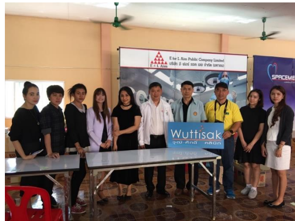
(2). ดำเนินกิจกรรมตามโครงการ “อี ฟอร์ แอล เอ็ม สัญจรสู่สังคมครั้งที่ 4” ณ วัดพระนอน ตำบลนายม อำเภอเมือง จังหวัดเพชรบูรณ์ - 18 กุมภาพันธ์.