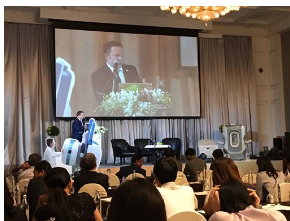
(3). การประชุม “IMAGING UPDATE IN MSK. WEIGHT BEARING MRI & STATE OF THE ART IN ULTRASOUND” กรุงเทพฯ - 20 กุมภาพันธ์.