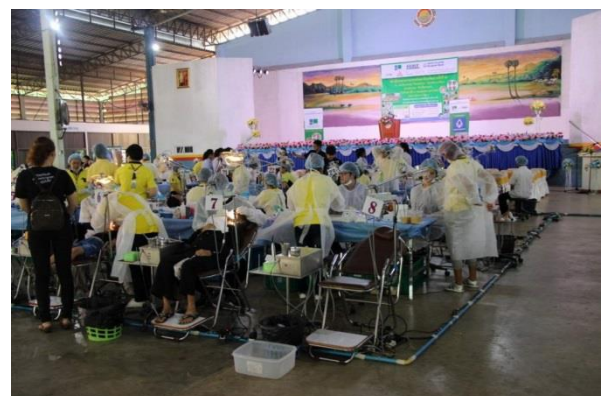
(6). ดำเนินกิจกรรมตามโครงการ “อี ฟอร์ แอล เอ็ม สัญจรสู่สังคมครั้งที่ 5”

ณ โรงเรียนแก่งวิทยสถานาร ต.ทางเกวียน อ.แก่ง จ.ระยอง 13 พฤษภาคม.