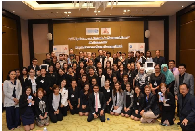
(7). จัดประชุมวิชาการ “2 nd Updates & Trends in Neonatal Care”