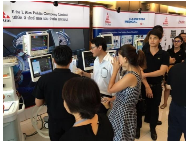
(4). แสดงผลิตภัณฑ์ ในหัวข้อ Travelling for Best Practice : Perioperative Pathway for Better Outcomes ร่วมกับ ราชวิทยาลัยวิสัญญีแพทย์แห่งประเทศไทย เพชรบุรี – 18-19 มีนาคม