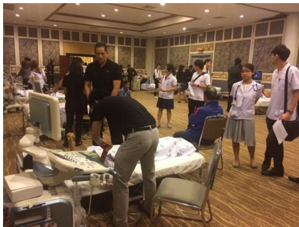
(1). Workshop ในงานประชุมวิชาการ Cardiac Network Fourm ครั้งที่ 9 จังหวัดพิษณุโลก – 7-10 กุมภาพันธ์