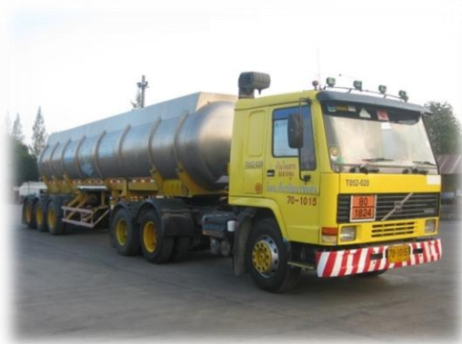
รถขนส่งแก๊ส

ขนส่งกว่า 700 คัน และมีรถบรรทุกหลายประเภทเพื่อให้เหมาะสมกับประเภทของสินค้าที่ขนส่ง อาทิเช่น รถ 6 ล้อ รถ 10 ล้อ รถหัวลาก หางพ่วงบรรทุก รถบรรทุกน้ำมันดิบ รถขนส่งแก๊ส เป็นต้น ทำให้บริษัทสามารถรองรับการขนส่งสินค้าได้หลากหลายตามความต้องการของลูกค้า ทั้งนี้ บริษัทยังให้บริการพิธีการกรมศุลกากรให้กับลูกค้าด้วย