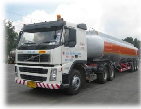
รถขนส่งน้ำมันดิบ