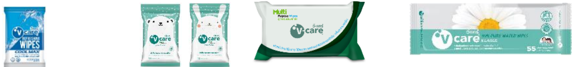
สูตรเย็นสดชื่น