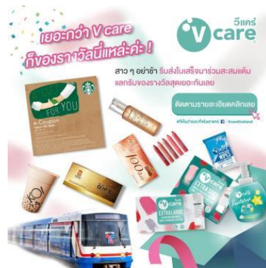
ช่องทางใหม่ Line@ Vcarethailand