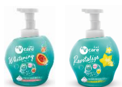
สบูโฟมอาบน้ำ