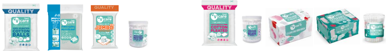
ผ้าเช็ดสำหรับทารก

ปัจจุบันกลุ่มผลิตภัณฑ์ภายใต้ตราสินค้า วีแคร์ ที่ทางบริษัทพัฒนาตราสินค้า บริหารจัดการด้านการตลาด และการจัดจำหน่ายครอบคลุมความต้องการที่หลากหลายเพื่อตอบสนองคนรุ่นใหม่ มีดังต่อไปนี้