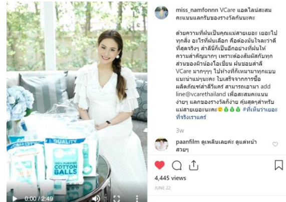
สื่อสารผ่าน Key Opinion Leader (KOL)