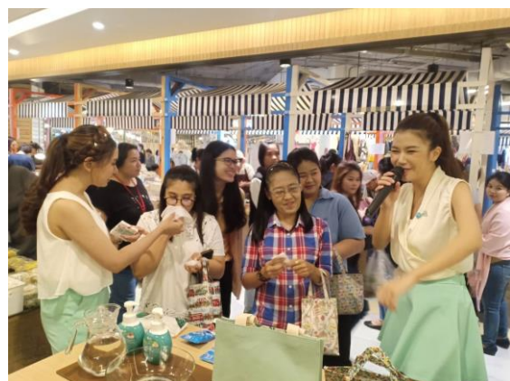
กิจกรรมออกบูธและแจกสินค้าตัวอย่าง

อีกหนึ่งความสำเร็จสำหรับปี 2562 ที่ผ่านมามีสำหรับแบรนด์วีแคร์ คือ ผลลัพธ์ในกลุ่มผ้าเช็ดทำความสะอาดแบบเปียกทั้ง 2 สูตร ซึ่งได้แก่ สูตรเย็นสดชื่นและสูตรแอนตี้แบคทีเรียล สามารถขยายช่องทางจัดจำหน่ายไปยังร้านสะดวกซื้อชั้นนำ อย่างเช่น 7-11 ได้ในช่วงกลางปี ด้วยคุณภาพและคุณสมบัติที่โดดเด่น ตอบโจทย์แนวโน้มผู้บริโภคยุคใหม่ที่มีความต้องการเรื่องสุขอนามัยเฉพาะตัวมากขึ้น รวมถึงเน้นความสะดวกสบาย ทำให้ผ้าเช็ดทำความสะอาดแบบเปียกทั้ง 2 สูตรของวีแคร์ ได้รับผลตอบรับเป็นอย่างดี รวมถึงกิจกรรมส่งเสริมการตลาดที่เน้นหนักการสร้างการรับรู้ของแบรนด์และการทดลองใช้ส่งผล ทำให้มีการเติบโตอย่างสูง มูลค่ารวมทั้งปีของกลุ่มผ้าเช็ดทำความสะอาดแบบเปียกของวีแคร์ เติบโตเพิ่มขึ้นถึง 74% โดยสัดส่วนการตลาดทางมูลค่ารวมทั้งปี เพิ่มขึ้นเป็น 6.8% (ข้อมูลจากนิลเสน ประเทศไทย, ธันวาคม 2562) ทำให้วีแคร์เติบโตเป็นแบรนด์อันดับ 4 ในตลาดผ้าเช็ดทำความสะอาดแบบเปียกของประเทศไทย