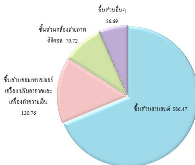
รายได้หลัก ปี 2562

ภาพรวมผลการดำเนินงาน งบการเงินเฉพาะบริษัทปี 2562 มีผลการลดลงจากปี 2561 มาจากยอดขายที่ลดลงของกลุ่มสินค้าอุตสาหกรรมยานยนต์ อุตสาหกรรมกล้องถ่ายภาพดิจิทัล และอุปกรณ์คอมพิวเตอร์เครื่องปรับอากาศและเครื่องทำความเย็น ในด้านต้นทุนขาย ค่าใช้จ่ายการผลิตส่วนใหญ่มาจากค่าแรงงาน ค่าใช้จ่ายในการผลิต และค่าเสื่อมราคาของเครื่องจักรและอุปกรณ์ ซึ่งในปี 2562 ได้มีการปรับผลประโยชน์พนักงานที่เปลี่ยนแปลง ทำให้มีต้นทุนขายต่อรายได้ของบริษัทในปี 2562 และปี 2561 เท่ากับร้อยละ 79.33 และ ร้อยละ 76.80 เพิ่มขึ้น