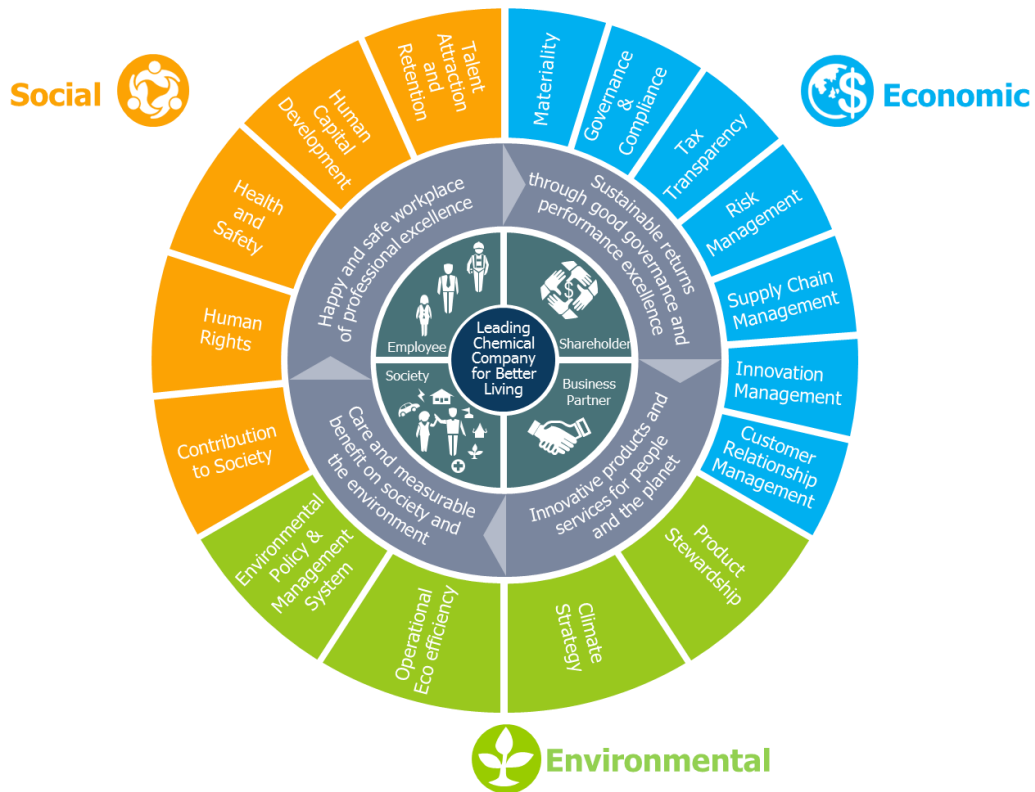
แผนภาพที่ 1: กรอบการดำเนินงานด้านความยั่งยืน

10.1 กรอบการดำเนินงานด้านความยั่งยืน (Sustainability Framework) ดังแสดงในแผนภาพที่ 1 ประกอบด้วย 16 องค์ประกอบ ครอบคลุมการสร้างความสมดุลใน 3 มิติ เศรษฐกิจ สังคม และสิ่งแวดล้อม ซึ่งจะมีการทบทวนเป็นประจำทุกปี ให้สอดคล้องกับสถานการณ์สังคมโลก และความท้าทายที่เปลี่ยนแปลงอย่างรวดเร็ว