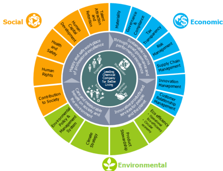
แผนภาพที่ 1: กรอบการดำเนินงานด้านความยั่งยืน

จากการทบทวนกรอบการดำเนินงานด้านความยั่งยืน (Sustainability Framework) ตาม DJSI และ UNGC รวมถึงประเด็นสำคัญต่าง ๆ ของโลกและประเทศไทย บริษัทฯ ได้พิจารณาและปรับองค์ประกอบของกรอบการดำเนินการดังกล่าว โดยเล็งเห็นความสำคัญของประสิทธิภาพเชิงนิเวศเศรษฐกิจ (Eco-Efficiency) ซึ่งเป็นประเด็น ที่ทั่วโลกให้ความสนใจและเป็นไปตามเป้าหมายการพัฒนาที่ยั่งยืน เพื่อก่อให้เกิดการใช้ทรัพยากรอย่างคุ้มค่า ที่มุ่งเน้นเศรษฐกิจหมุนเวียน (Circular Economy) ให้สอดคล้องกับสถานการณ์สังคมโลก โดยกรอบการดำเนินงานด้านความยั่งยืนของ GC ปรากฏดังแผนภาพที่ 1