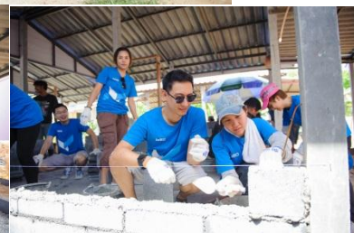
ภาพกิจกรรมอาสาสมัคร โครงการ “คุณได้บ้าน = คุณให้บ้าน” ณ ชุมชนร่วมใจสามัคคี จังหวัดระยอง วันที่ 28-29 มิถุนายน 2557