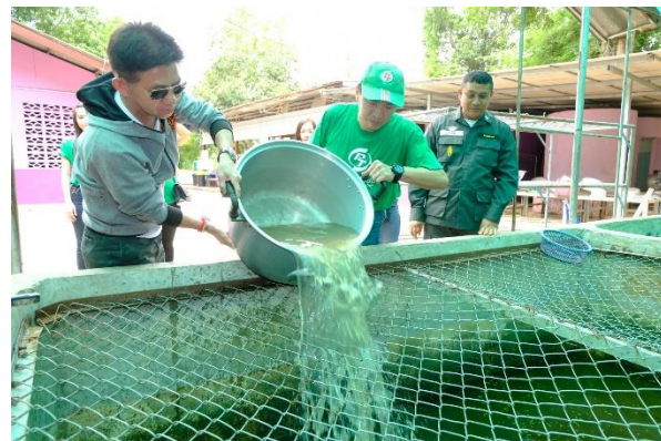
การเลี้ยงปลาดุกในบ่อซีเมนต์จำนวน 1,500 ตัว