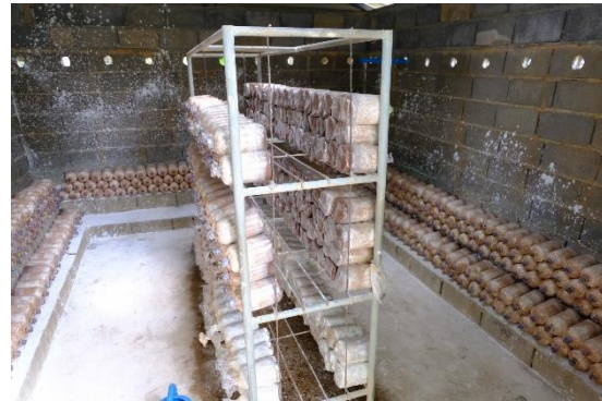
โรงเรียนเพาะเห็ดนางฟ้า