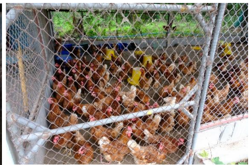
การเลี้ยงหมู ไก่ไข่ เพื่อบริโภค

นอกจากนี้ บริษัทเจริญชนพนักงานจิตอาสา ๓ สำนักงานใหญ่ ร่วมแพ็คถุงยังชีพเพื่อมอบให้แก่เด็กนักเรียน จำนวน 240 ถุง และจิตอาสาที่เป็นอาสาสมัครร่วมเดินทางไปยังโรงเรียน จำนวน 65 ท่านส่งเสริมให้พนักงานได้มีส่วนร่วมในกิจกรรมเพื่อสังคม พร้อมทั้งจัดกิจกรรมสันทนาการ สร้างรอยยิ้ม เลี้ยงอาหารกลางวัน มอบความสุข ให้แก่เด็กนักเรียน ซึ่งโครงการดังกล่าว บริษัทให้ความสำคัญในการสนับสนุนและส่งเสริมการพัฒนาทางการศึกษา และพัฒนาคุณภาพชีวิตของเยาวชน ให้เติบโตเป็นบุคคลที่มีคุณภาพ มีจิตสำนึกที่ดี มีวินัย มีความรู้คุณธรรม เพื่อเตรียมความพร้อมสำหรับการก้าวเข้าสู่สังคมอย่างสมบูรณ์แบบ