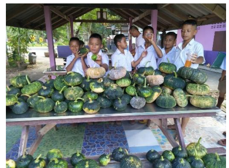
การบูรณาการการเกษตรเพื่ออาหารกลางวันกับการเรียนการสอนในหลักสูตร